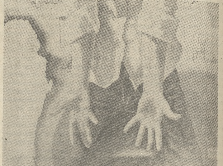
Νεώριος οδηγός μοτοποδηλάτου τραυματίστηκε χθες σοβαρά...