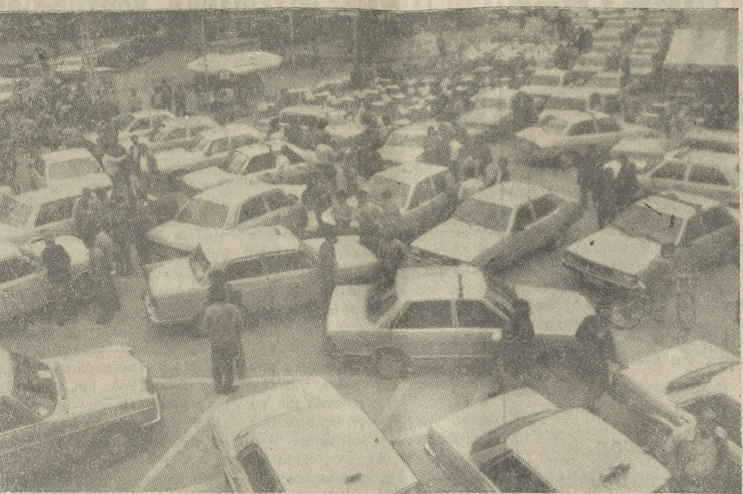
Τα ταξί καθώς έχουν αποκλείσει το κέντρο της πόλης μας.