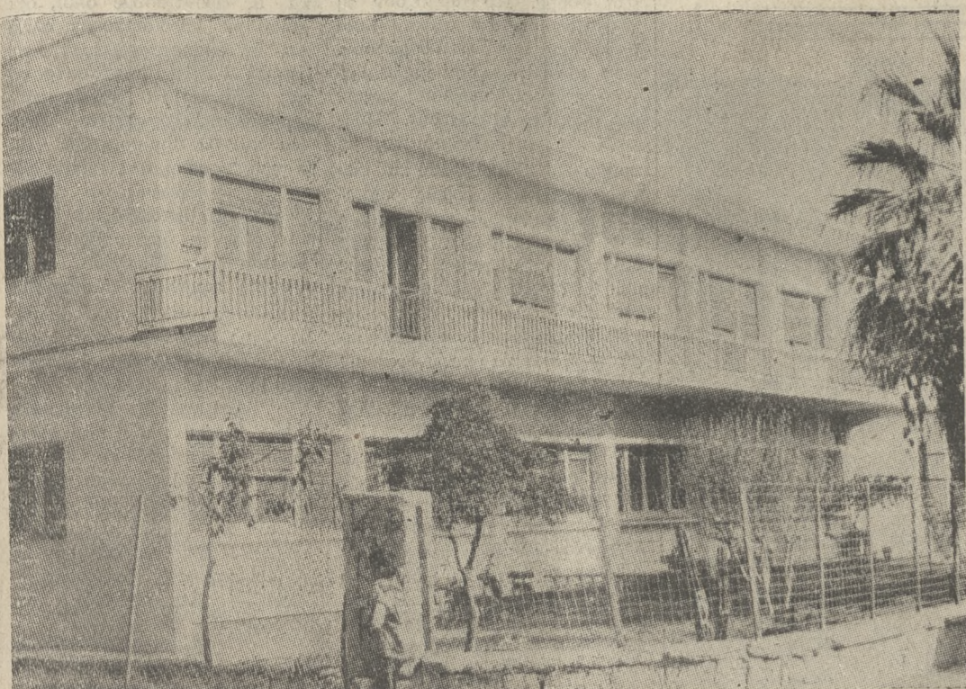
Το κτίριο της Μηχανικής Καλλιέργειας, που θα λύσει, έστω προσωρινά, το στεγαστικό πρόβλημα του 26ου Δημοτικού Σχολείου.