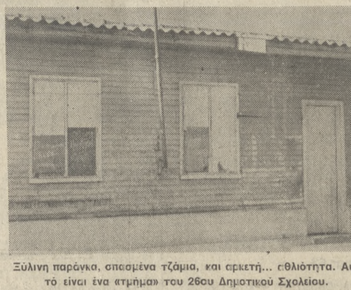
Σύλινη παράγκα, σπασμένα τζάμια, και αρκετή... εθλιότητα. Αυτό είναι ένα ατμήσιο του 26ου Δημοτικού Σχολείου.

ΣΠΟΥΡΑ αν κάποιοι επικρατούν το χόρο όπου υποτίθεται ότι στεγάζεται το 26ο Δημοτικό Σχολείο που βρίσκεται στην περιοχή Κοιμίων, θ' αναρωτηθεί: — Είναι δυνατόν τέλος του 1984 να λειτουργεί διδακτήριο με τέτοιες πρωτόγονες συνθήκες; — Είναι δυνατόν αίδουσε νέες σχολεία να καταλαμβάνουν διαμέτρο άνω των 500 μ.; Γιατί το λέμε; ΠΛΑ τον απλοστολό λόγο ό τι στο κυρίως διδακτήριο στεγάζονται 5 λύκειοι (1) αίδουσε, ενώ συγχρόνως άλλες 10 αίδουσε διακοσμημένες στη γύρω περιοχή (οθώνων μέχρι το γήπεδο του ΟΦΗ) χρησιμοποιούνται για να κλύουν τις λειτουργικές του ανάγκες. ΑΙΔΟΥΣΕ με σπασμένα τζάμια, τουαλέτες (που καλύτερα είναι να μην περνάς ούτε