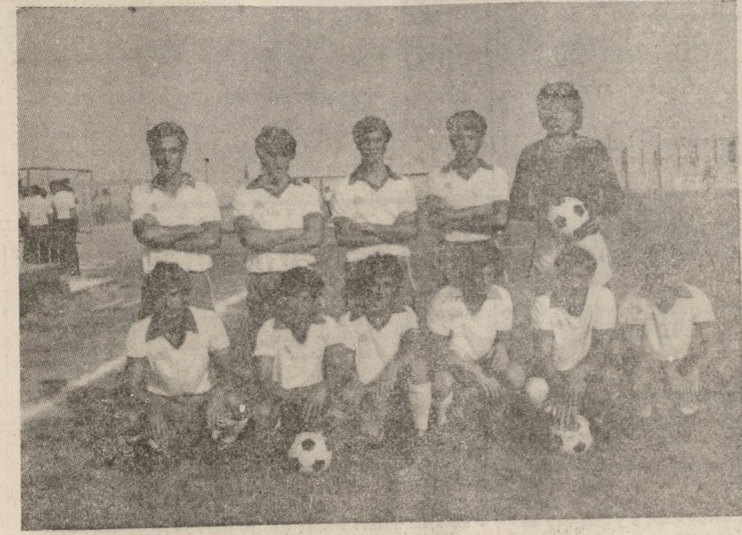
ΑΥΡΙΟ ΣΤΗΝ ΑΛΙΚΑΡΝΑΣΣΟ