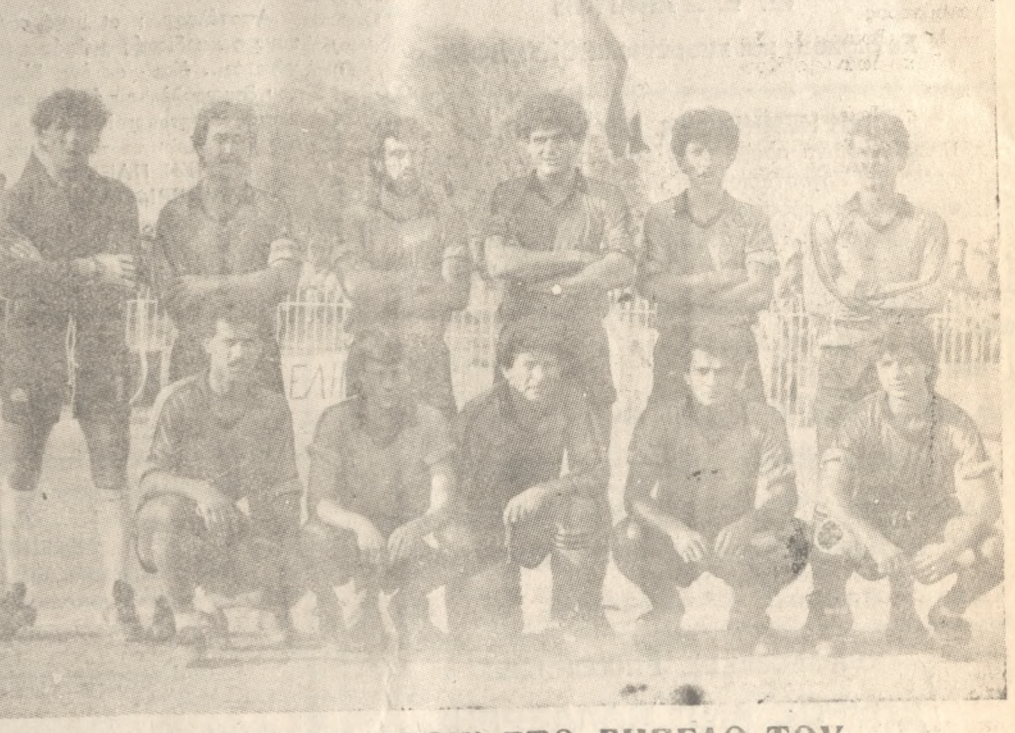
ΑΥΡΙΟ ΤΟ ΠΡΩΤ' ΣΤΟ ΓΗΠΕΔΟ ΤΟΥ