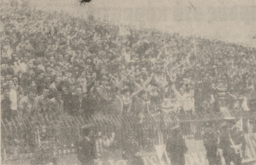
Ένα τμήμα από τις κατόματες και «πυρακτωμένες» την Κυριακή κερκίδες του γηπέδου του ΟΦΗ. Ο φιλάθλος κόσμος του Ηρακλείου έδωσε την Κυριακή ένα συγκινητικό παρών.