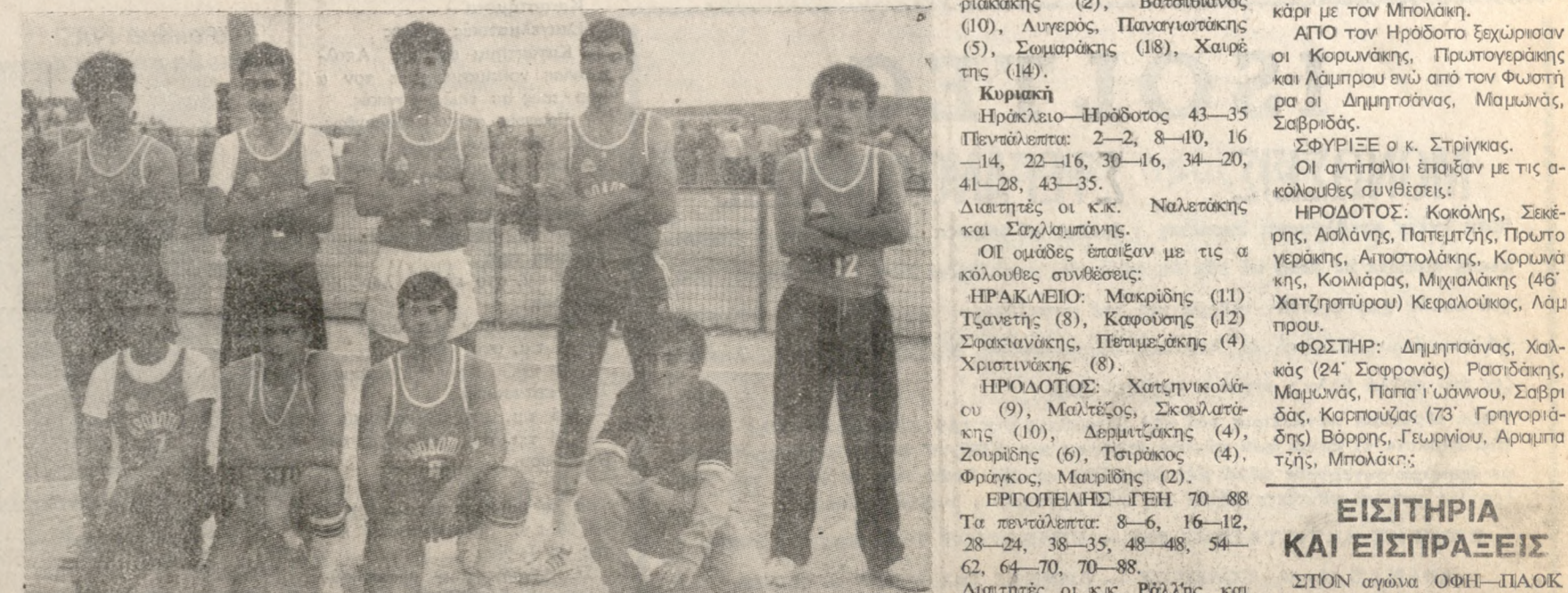
Η Παιδική ομάδα του Ηρόδοτου που κέρηκτησε τον τίτλο του τουρνουά. Συνεχία στη σελ. 5