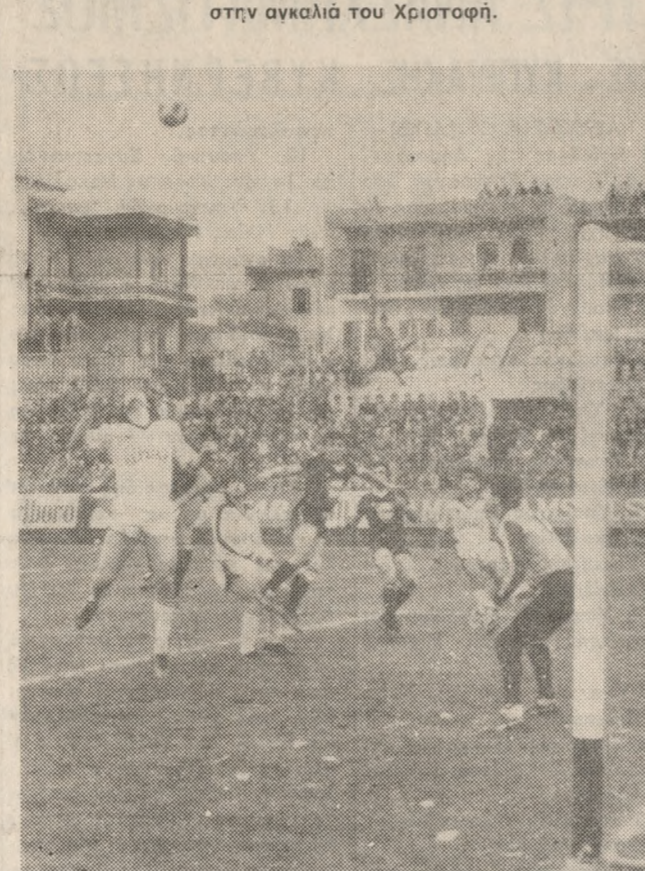
Μία ακόμη φάση από τον συναρπαστικό αγώνα της Κυριακής μεταξύ ΟΦΗ - ΠΑΟΚ (3-1).

ντέλη από την άλλη. Το 3-1 ήταν γεγονός και έμελλε να είναι το τελικό αποτέλεσμα. ΣΤΟ 87' μετά από σουτ του Νισίλια από αριστερά η μπάλα έφυγε ελαφρώς άουτ.