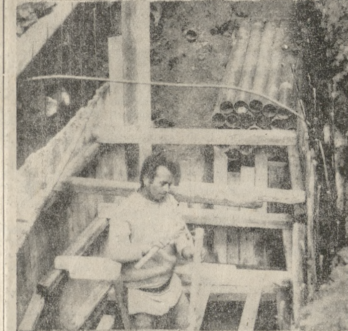
Έργα υποδομής στην Ιδεομενής. Η τελεσίτητα ενσποφεικτα, αλλά... ουδέν κακόν αμιγές καλού...