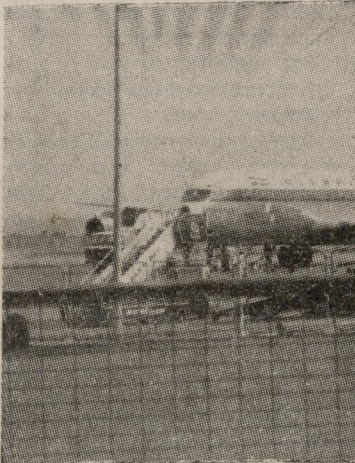
Η περιπέτεια έχει τελειώσει και το «Μπόϊνγκ 707» της πτήσης 503 ετοιμάζεται ν' αναχωρήσει για την Αθήνα.

Όπως γράφουμε παραπάνω στις 10.20 π.μ. γίες έγινε το τηλεφώνημα—φάρσα, στο Ελληνικό. Η «φάρσα» όμως που ανέφερε ο φαρσέρ ήταν που μετέ-