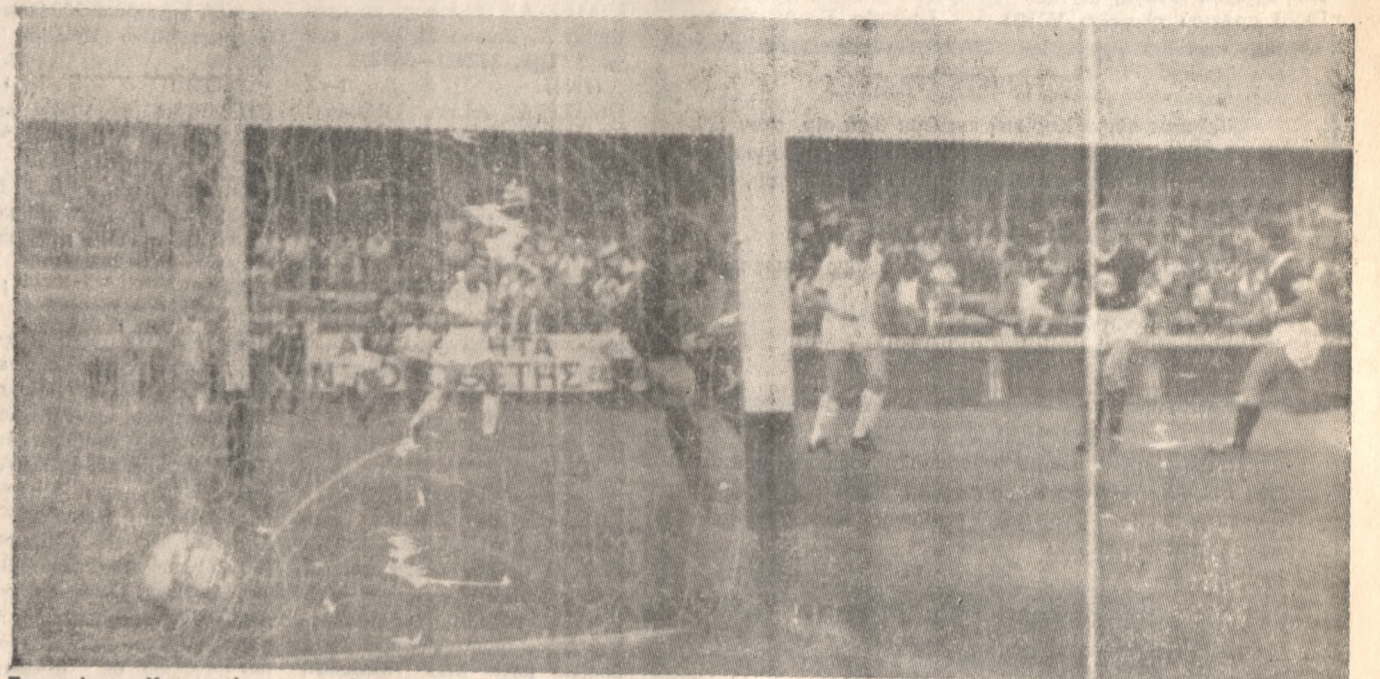
Το γκολ του Χριστοφί με το οποίο ο ΟΦΗ είχε κέρδι στο Ηράκλειο τον Απόλλωνα Αθηνών με σκορ 1—0, στον α’ γύρο.