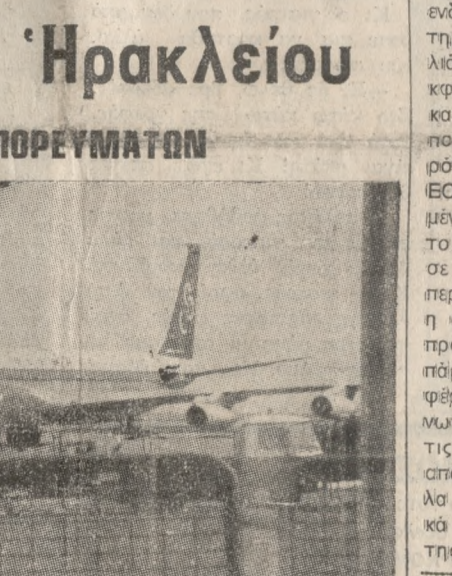
18,260) ο του εξωτερικού, και 5,930) ο του εσωτερικού.

Αριθμούς (επομένους και ρυθμούς) πραγματικά εντυπωσιακούς παρουσιάζει στην κίνησή του τα τελευταία χρόνια, το αεροδρόμιο του Ηρακλείου, αποδεικνύοντας έτσι, ότι είναι ή να από τα δυναμικότερα αεροδρόμια της χώρας. Αυτό προκύπτει, από πίνακα τον οποίο εδόσε χθες στη δημοσιότητα η Αερολιμενική Διεύθυνση του Αερολιμένα Ηρακλείου, και ο οποίος περιέχει στατιστικά στοιχεία τον έτών 1980, 81, 82, 83 και 84.