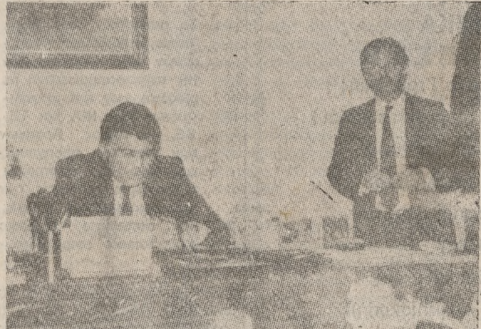
Ο κ. Παπαδοπούλου ανακοινώνει στους δημοσιογράφους αποφάσεις για τους τομείς δράσης του Υπουργείου του.

ΕΤΣΙ, εάν και εφ' όσον αυτή η δοκιμαστική πτήση αποδείξει ότι όπως θεωρητικά έτσι και πρακτικά οι προαίτιες - απογευμαίσιμες πτήσεις να γίνονται στο Καστέλι με απόλυτη ασφάλεια, τόσο για τα αεροπλάνα, όσο και για το κοινό, θα σταματήσει επί τέλους η «Χανιώτικη» Οδύσσεια των επιβατών (κυρίως).