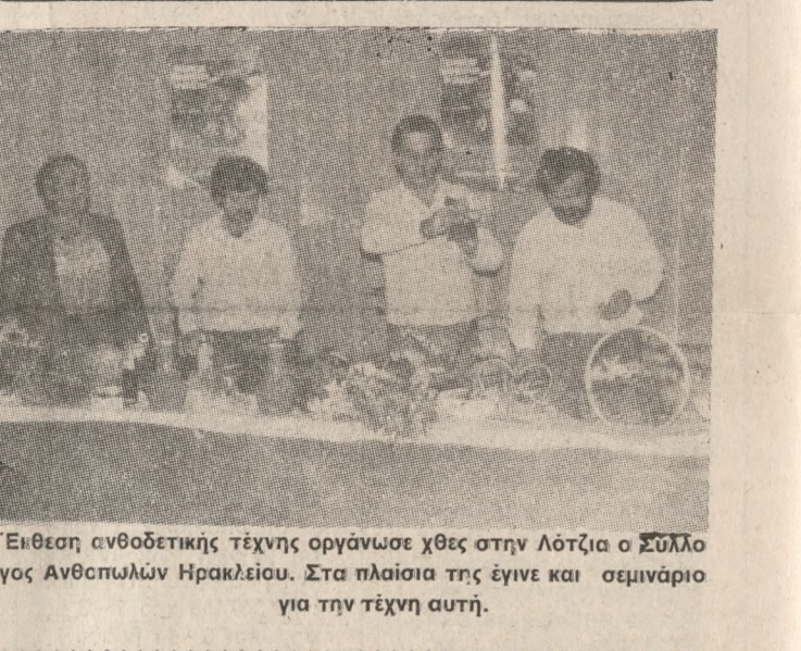
Έιθεση αναθεωρητικής τής οργάνωσης χθες στην Λότζια ο Σύλλογος Ανοθετών Ηρακλείου. Στα πλαίσια τής έπισης και σεμινάριο για τήν τέχνη αυτή.

ται από σήμερα στην αίθουσα Θεοτοκόπουλος (πάνω από τήν Βικελία). Οι παραστάσεις θα αρχίσουν στις 9 τόν βράδυ και θα διδοθούν καθημερινά πέντε Δευτέρας και Τρίτης τήν ίδια ώρα έως 24 Μαρτίου. Όσοι θέλουν να τς δουν θα πρέπει εγχαίρως να εφοδιάζονται με ειστήρια, γιατί η αίθουσα δεν χωράει παραπάνω από 180 άτομα. Με τήν ευκαιρία οι υπευθύνουμοι τούς συνταξιστές τού έργου: Σκηνοθέτης ο κ. Μπάκας, σκηνογράφος ο Ν. Σαριδάκης, ενώ τή μετάφραση έκανε ο Α. Καλλέργης. Βοηθός σκηνοθέτης η Α. Βενέτη. Παίοντες οι ηθοποιοί: Μ. Αεράκης, Γ. Βεσής, Α. Κουσαλίνης, Ε. Μαραγκοδάκης, Ε.ρ. Μαρκογιάννη, Π. Ξενοκλής, Γ. Οικονομίδης, Π. Παραβου, Π. Ραππάκης, Ε. Σκούρτος, Β. Σταύρακα.