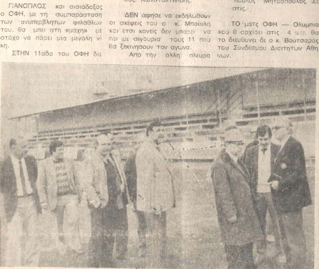
Οι εκπρόσωποι της ΟΥΕΦΑ και της ΕΠΟ μαζί με παράγοντες του Ηρακλείωτικου ποδοσφαίρου, χθες το πρωί στο γήπεδο του ΟΦΗ.

ΤΟ μάτς ΟΦΗ — Όλυμπιακού άρχισε στις 4 μ.μ. Θα το διεξάγει ο κ. Βουτσάρας του Συνδέσμου Διετήτων Αθλητών.