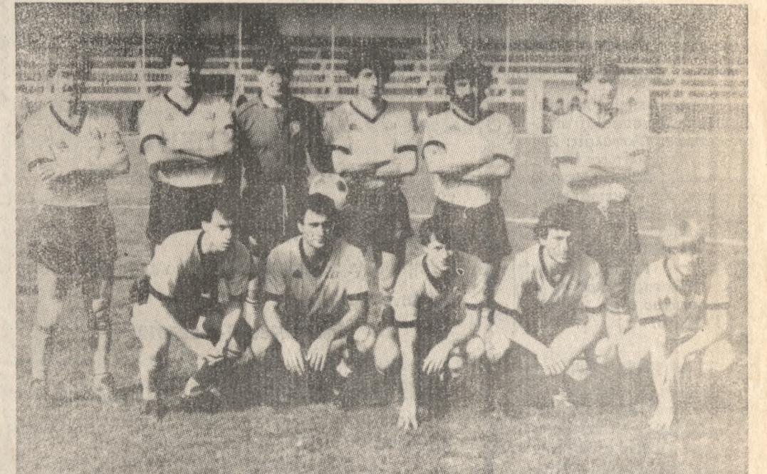
Εργοτέλης, ο οποίος με την εκτός έδρας νίκη του επί του Αργοναύτη, αύξησε τις ελπίδες του για την κατάκτηση του τίτλου.