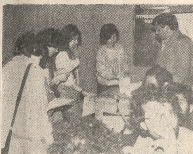
Με απόλυτη τάξη προσήλθαν χθές στις κάλπες και άσκησαν το εθνικό τους δικαίωμα οι φοιτητές του Πανεπιστημίου Κρήτης. Στην φωτογραφία μας έινε στιγμιότυπο από την ψηφοφορία στην Φ.Μ.Σ.