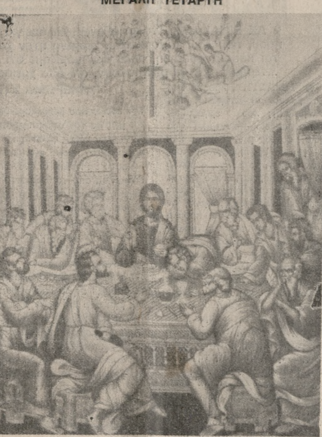
Τού Δείπνου Σου του μυστικού...

29 ΑΠΡΙΛΙΟΥ Η ΤΕΛΕΤΗ ΑΠΟΦΟΙΤΗΡΙΩΝ ΤΗΣ 84 Δ' ΕΣΣΟ θα γίνει στις 29 Απριλίου, στο Στρατόπεδο «Δασκαλογιάννη» (ΣΕΒΑΠ).