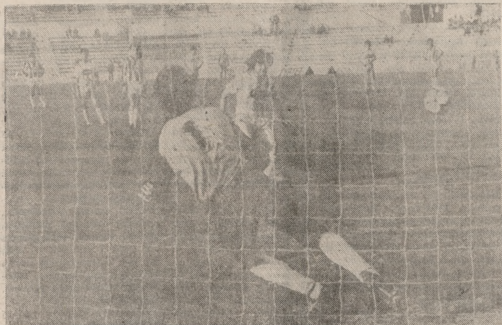
Μία φάση από τον αγώνα Ηρακλή - ΟΦΗ του α' γύρου. Ο Κατήνεργος εκτελεί πέναλτι, ενώ κάτω από τα δοκάρια είναι ο Χασάδας.

Ο αγώνας δ' αρχίζει στις 4.30' μ.μ. ακριβώς