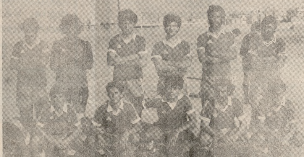
Ο Ποσειδώνας, ο οποίος βρίσκεται πολύ κοντά στη ουτρία. Θα πετύχει το στόχο του αν κερδίσει το αυριανό ματς με τον 'Αρη.

ΣΤΟΝ α' γύρο ο Εργοτέλης είχε κερδίσει με 3-0 τον Α.Σ. Ποντίων.