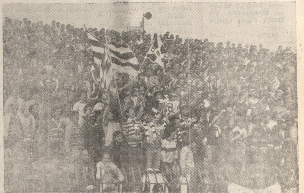
Ο υπέροχος λαός του ΟΦΗ, η μεγάλη δύναμη του Ηρακλειώτικου Συλλόγου, αναμένεται ότι θα δώσει κύριο ένα συγκλονιστικό παρών στον αγώνα με τον Ηρακλή.

ΣΤΟΝ α' γύρο ο Ηρακλής είχε κερδίσει τον ΟΦΗ με 3-1.