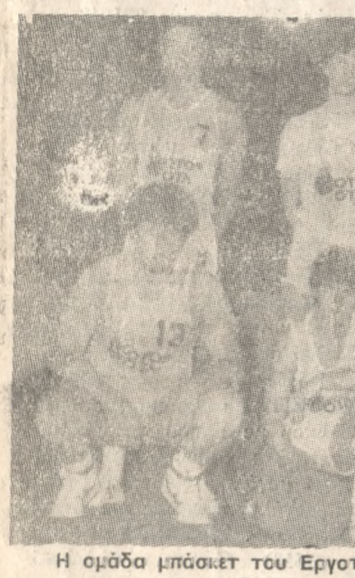
Η ομάδα μπάνκετ του Εργοτέλη η οποία θα διεκδικήσει σήμερα τον τίτλο του πρωταθλητή Κρήτης, από τον Κύδωνα, στο ουδέτερο γήπεδο του Ρεθύμνου.

ΟΠΩΣ πέρσι και φέτος το γήπεδο του Ρεθύμνου θα γίνει τόπος «μονομαχίας», που θα έχει σαν μήλο της Έριδος τον τίτλο του Πρωταθλητή Μεσογειακής Κρήτης για την περίοδο 1985. Αντιμέτωποι θα βρεθούν, σήμερα στις 7 μ.μ., ο Εργοτέλης και ο Κύδωνας, ομάδες που τερμάτισαν μαζί στην κορυφή μετά και τους 10 αγώνες του πρωταθλήματος.