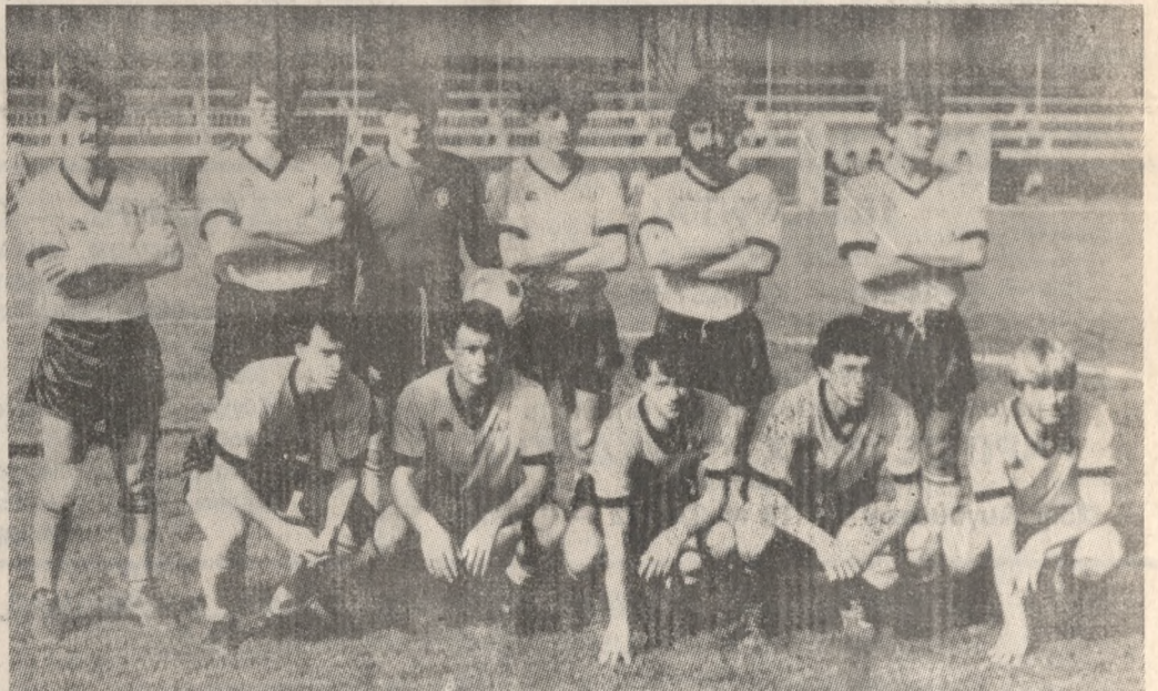
Ο Εργοτέλης, ο οποίος ισοβάθμισε στην κορυφή της βαθμολογίας με τον Ολυμπιακό Χαλκίδας και θεωρείται ίσχυρο ότι θα παίξουν μεταξύ τους μπαράζ, για την ανάδειξη του πρωταθλητή.

Ο ΟΡΓΟΤΕΛΗΣ κερδίζοντας στο Ρέθυμνο τον Κεραυνό με 4-2 βρέθηκε στην κορυφή του βαθμολογικού πίνακα μαζί με τον Ολυμπιακό Χαλκίδας, ο οποίος έφερε 1-1 στα Χανιά με τον Μινώταυρο. Τώρα όλα δείχνουν ότι Εργοτέλης και Ολυμπιακός θα χρειαστεί να παίξουν μπαράζ για να αναδειχθεί ο πρωταθλητής. Όσον αφορά τον Ποσειδώνα αυτοκτόνησε και τίποτα τώρα δεν τον σώζει από τον υποβιβασμό, έστω και αν κερδίσει το ματς που μένει και τους βαθμούς από το ματς με τον Περαμαϊκό που είχε διακοπή.