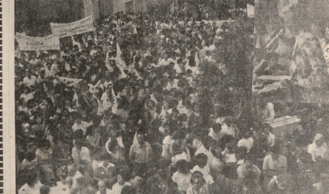
Από την χθεσινή συγκέντρωση της ΕΓΕ στη Πλατ. Δασκαλογιάννη.

Παρά το γεγονός ότι εγγυώμενος ότι οι κακοποιοί ήταν μέλη της ΟΝΝΕΔ, ελιπίσαμε και θέλαμε να πιστώσουμε ότι επίσημα τουλάχιστον η οργάνωσή τους ή θα σώπαινε, ή θα καταδίκαζε την πράξη τους και για λόγους πολιτικής σκοπιμότητας, και για λόγους ντροπής για την ποιότητα τέτοιων μελών της Γελοστήλας. Ούτε γνέπονται, ούτε τους ενδιαφέρουν οι συνέπειες της οργής που προκάλεσαν στην κοινή γνώμη. Αυτό τουλάχιστον αποκαλύπτει η «καταγέλιος που δόθηκε στη δημοσιότητα. Και αυτή η διαπίστωση, σημαίνει πολλά. Δίνει το... βαθύτερο περιεχόμενο ενός επισκοπούμενου «πιστεύω» προς τους δημοκρατικούς θεσμούς. Δίνει το μέτρο του σεβασμού της λειτουργίας των εξουσιών και του Τύπου, και αποκαλύπτει τη μεθοδολογία που ακολουθείται για την έκφραση αυτού του σεβασμού. Επιστημονική, με λίγα λόγια, το ρόπαλο και τη βία ως τα πρακτικά μέσα έκφρασης του πολιτικού και κοινωνικού επίπεδο, μιας ιδεολογίας που υψώσασα κόπτεται για να παίσει ότι είναι... δημοκρατική. Τι λέει γι' αυτό άραγε η Τοπική ηγεσία της Ν.Δ.;