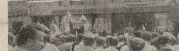
Στιγμιότυπο της συγκέντρωσης του ΠΑΣΟΚ στο Καστέλλι Πεδιάδος με ομιλήτη τον υφυπουργό και υποψήφιο βουλευτή, Κώστα Ασλάνη.

Συνεχίζονται με απόλυτη επιτυχία οι προεκλογικές περιόδους του ΠΑΣΟΚ με επικεφαλής τους υποψηφίους βουλευτές του κινήματος στα χωριά του Νομού.