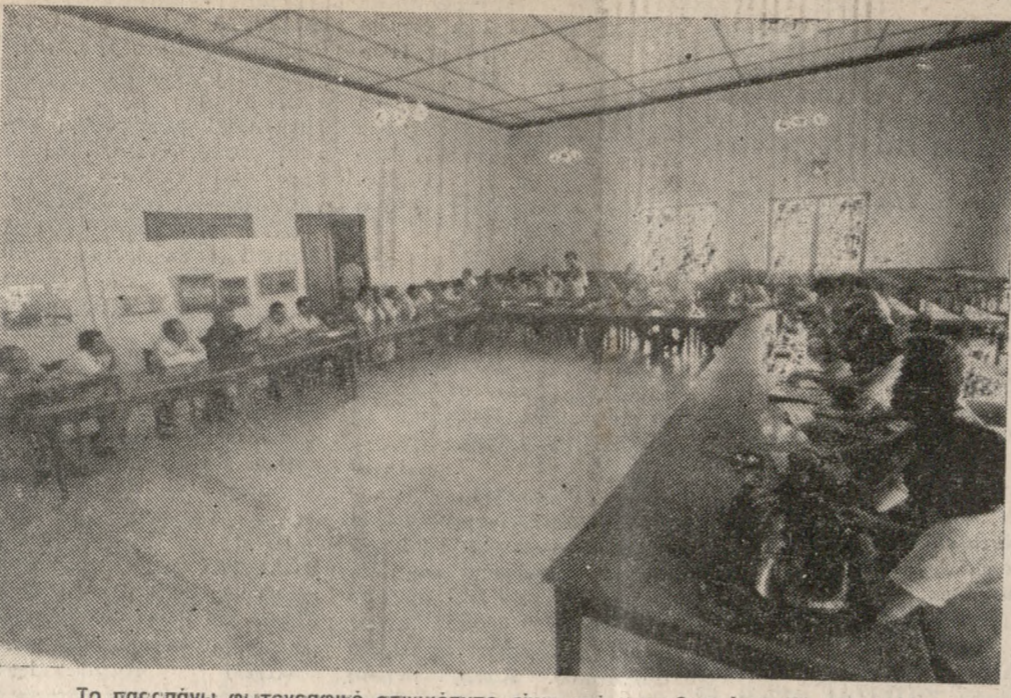
Το παρσπάνω φωτογραφικό στιγμιότυπο είναι από την χθεσινή συνάντηση του Δημάρχου κ. Καρέλλη και των υποψηφίων βουλευτών του Ηρακλείου, που έγινε στην αίθουσα «Θεοτοκόπουλος».

ΑΝΑΚΟΙΝΩΣΗ Ο Ορειβατικός Σύλλογος Ηρακλείου πραγματοποιεί εκδρομή με στο Σρακιανό Φαράγγι στις 25-26 Μαΐου. Αναχώρηση το Σάββατο στις 3 μ.μ. από την πλατεία Μουσείου και διανυκτερεύση στα Σρακιά. Την Κυριακή το πρωί από την Ίμβρο, η νύβηση στην περιοχή «Καλού Λάκκου» (Μιάττα Τσιριμωφίδου) και από εκεί κατάβαση από το Σρακιανό φαράγγι, με κατάληξη τα Σρακιά. Οι ώρες πορείας είναι 5. Όποιοι θέλουν να διανυκτερεύσουν σε πανσιόν ή να συμμετάσχουν σε γεύμα, να το δηλώσουν έγκαιρα. Πληρωφ. στο τηλ. 287110 9-10 κάθε βράδυ.