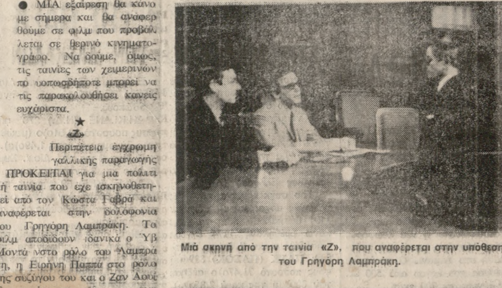
Μία σκηνή από την ταινία «Ζ», που αναφέρεται στην υπόθεση του Γρηγόρη Λαμπράκη.