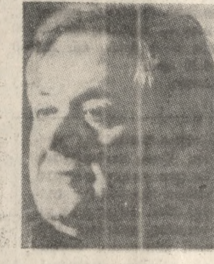
Ο Μάνος Χατζιδάκης

Μετά από μια πρόσκαιρη όπως φαίνεται διαμάχη με τους εκπροσώπους του Δήμου, ο Μάνος Χατζιδάκης εμφανίστηκε και πάλι στις καλοκαιριτικές εκδηλώσεις «Ηράκλειο - Καλοκαίρι '85» με μιά του συνάντησή του με κάποιους εκδηλωτές. Θα παρουσιάσει από γνωστά ολοκληρωμένα έργα του με ερμηνεύτρια την Μαρία Δημητριάδη. Το Ηρακλειώτικο Κοινό θα έχει την ευκαιρία να «ρουφιξει» την μουσική Χατζιδάκη, τη μουσική του ενός από τους δύο μεγάλους ογκολίθους της έντονης μουσικής μας. Η «Π» δημοσιεύει σήμερα μια ενδιαφέρουσα συνέντευξη που έδωσε ο μουσικοκρίτης στον συντάκτη της Γ. Λαγουβάρδο. Μια συνέντευξη με γενικότερο ενδιαφέρον, μια και ο Μάνος Χατζιδάκης μιλάει σ' αυτήν με όλη την ειλικρίνεια που του διακρίνει. Ακόμη, μιλάει για τον άλλο μεγάλο, τον Μίκη Θεοδοφιάνη και την συνεργασία τους.