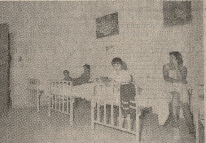
Η νέα πτέρυγα της Παιδιατρικής Κλινικής στο Βενιζέλιο.