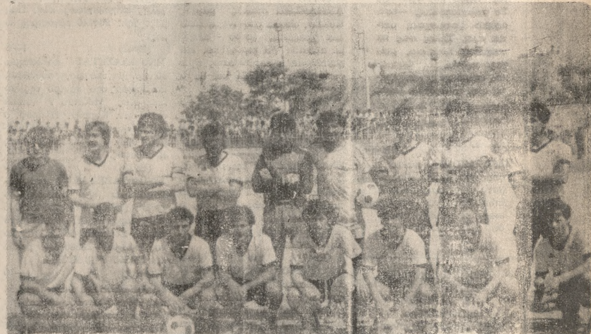
Ο δημοφιλής Εργατέλης, ο οποίος αγωνίζεται σήμερα στη Μυτιλήνη, διεκδικώντας άνοδο στην Γ' Εθνική Κατηγορία.

• ΠΕΦΤΕΙ αύριο το απόγευμα η αυλαία του πρωταθλήματος Α' Εθνικής Κατηγορίας και ο ΟΦΗ αγωνίζεται στο γήπεδο του με τον Πανιώνιο. Το Ηρακλειώτικο συγκρότημα θέλει να κάνει φινάλε με μια νίκη για να ωτάσει τους 27 βαθμούς και να πάρει την 9η ή 10η θέση, ανάλογα με το αποτέλεσμα το οποίο θα φέρει ο Εθνικός στην έδρα του με τον Ηρακλή. Έτσι από αύριο το απόγευμα το πρωτάθλημα περιόδου 1984—85 θ' ανήκει στην ποδοσφαιρική ιστορία. Και ενώ έχει αναδειχθεί ο πρωταθλητής και οι δύο ομάδες που θα υποβιβαστούν, αγωνιά επικρατεί μεταξύ Παναθηναϊκού, ΑΕΚ και Ολυμπιακού για ποιός θα είναι ο δυοσπό τις τρεις ομάδες που θα βγουν στην Ευρώπη, μαζί με τον ΠΑΟΚ (πρωταθλητή) και την Λάρισα (κυπελλούχων) ανεξάρτητα από το αποτέλεσμα του τελικού του Κυπέλλου.