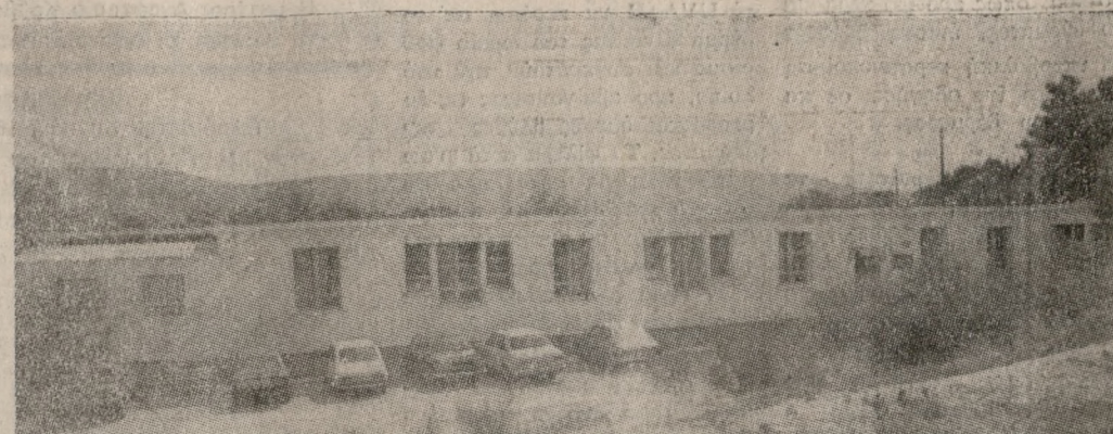
Τα νέα Εξωτερικά Ιατρεία του Βενιζελείου.

κτιζονται 6 Κέντρα Υγείας τρία από τα οποία έχουν παραδοθεί έχουν εξοπλιστεί και θα λειτουργήσουν τον επόμενο μήνα.