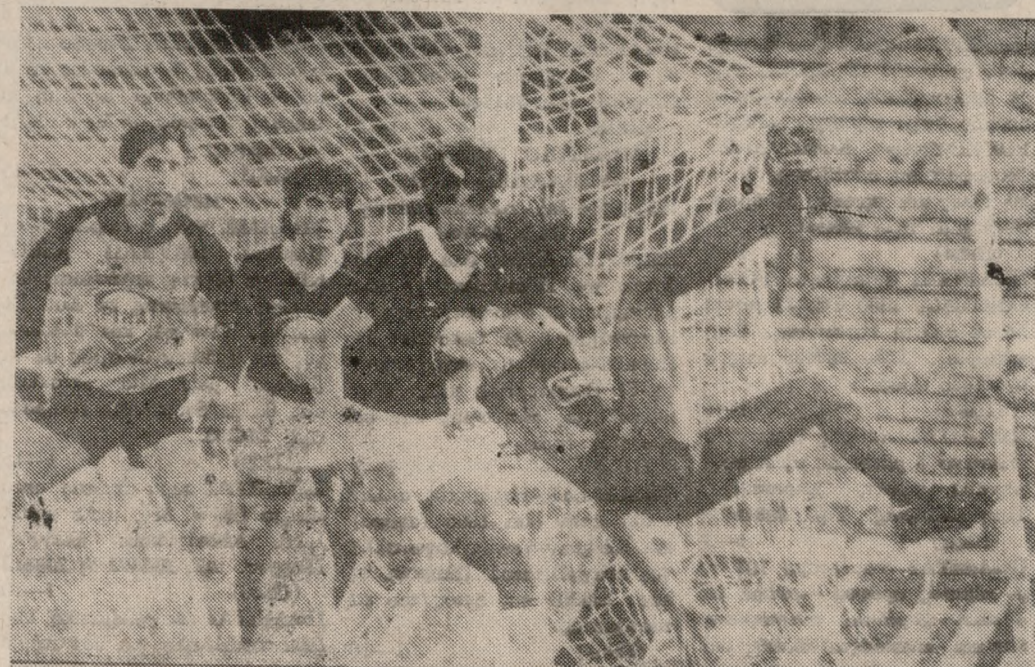
Μια φάση από τον αγώνα του α' γύρου μεταξύ Πανιωνίου — ΟΦΗ, που είχε λήξει ισόπαλος (1—1).

Κομπλέ δά αγωνισθεί το ‘Ηρακλειώτικο συγκρότημα