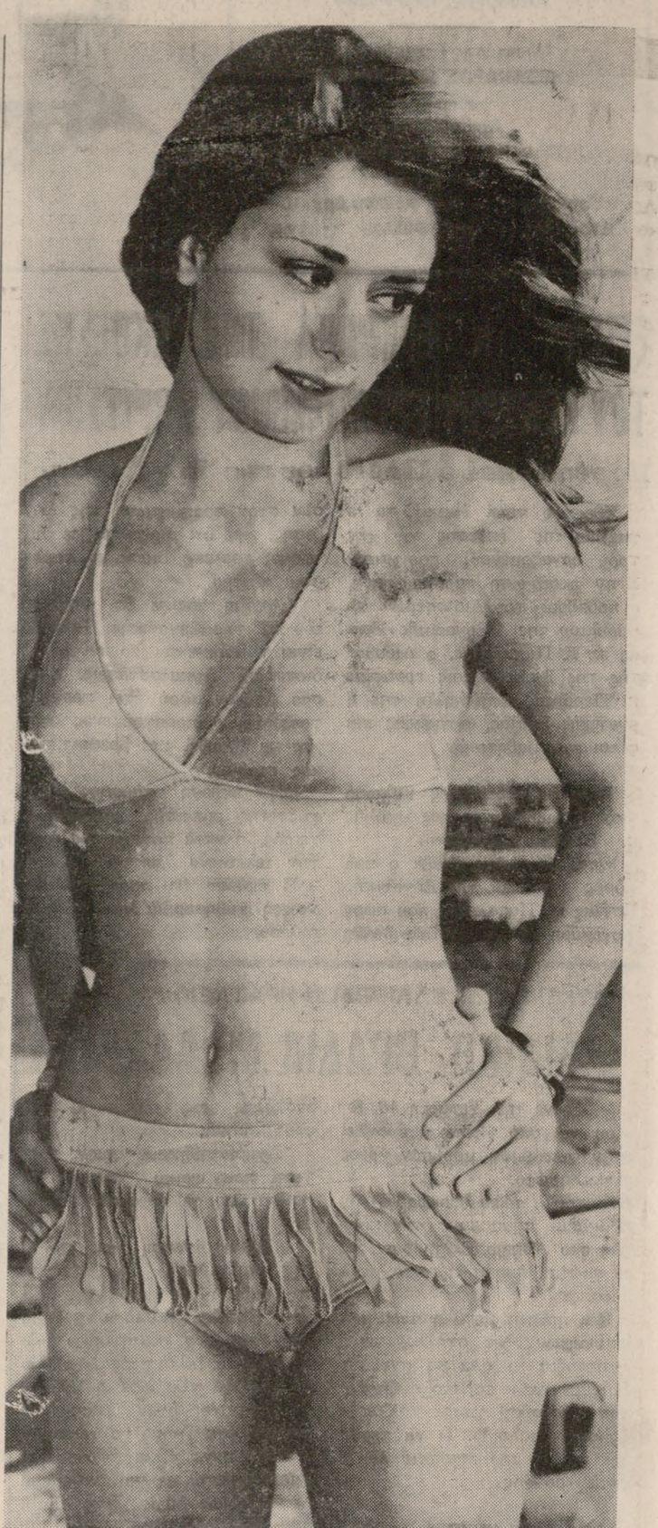
ΜΙΑ ΦΙΛΙΚΗ ΣΥΓΚΕΝΤΡΩΣΗ ΤΗΣ HELENA RUBINSTEIN ΣΤΟ «ΑΓΑΡΙ BEACH»

Η HELENA RUBINSTEIN καλεί στο όμορφο νησί της Κρήτης, τις φίλες της, σε φιλική συγκέντρωση, στην πίστα του ξενοδοχείου «ΑΓΑΡΙ BEACH». Αφού Δευτέρα 24 Ιουνίου η HELENA RUBINSTEIN οργανώνει στην πίστα του ξενοδοχείου «ΑΓΑΡΙ BEACH» μια φιλική συγκέντρωση που την συνοδεύει «POOL RUNCN PARTY». Με την ευκαιρία αυτή θα παρουσιάσει η αντιπλησκή αντιρυτιδική σειρά GOLDEN BEAUTY SUN REPAIR. Για αυτό ακριβώς παρουσιάζει για πρώτη φορά στην Ελλάδα την αντιηλιακή, αντιρυτιδική σειρά GOLDEN BEAUTY SUN REPAIR στο χώρο όπου ανήκει στη θάλασσα και στον ήλιο.