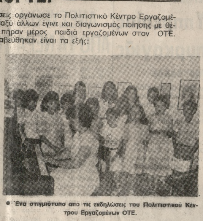
• Ένα στιγμιότυπο από τις εκδηλώσεις του Πολιτιστικού Κέντρου Εργαζομένων ΟΤΕ.

ΕΙΡΗΝΗ Τό 'να μου χέρι στο σωματόπλεγμα Η φωνή μου φωτιά μέσα μου θέλει να πετάξει Λάτρη, να σκίσει τον αέρα να καρφωθεί στα δέντρα των βουνών να γίνει ένα με το ούρασμα των λίκων και με το σπυροίτημα των απρών, να γίνει κύμα στο πέλαος, βράχος στ' ακρογιάλια. Μα κοιτάει νεκρή μέσα μου Τό 'να μου χέρι στο σωματόπλεγμα Δuo σταγόνες αίμα νερό. Δuo μαύρα μάτια καρδιά. Η δόνηση απόγνωση Ο γολγοθός μαρτύριο Η καρδιά χόμα Τό 'να μου χέρι στο σωματόπλεγμα Τ' άλλο μου στη ζωή της ο-λύμπας και τον λεκού περιστεριού, να καρφώσει τη βλοσυρήν τούτη ώρα της ΕΙΡΗΝΗΣ που όμως δε λείπει να 'ρθει. Άνθρωπε σκεφτήρα... ΕΙΡΗΝΗ Καλήμέρα σου Τζων. Καλήμέρα σου Ίβαν. Για σιμάστες κοντά,