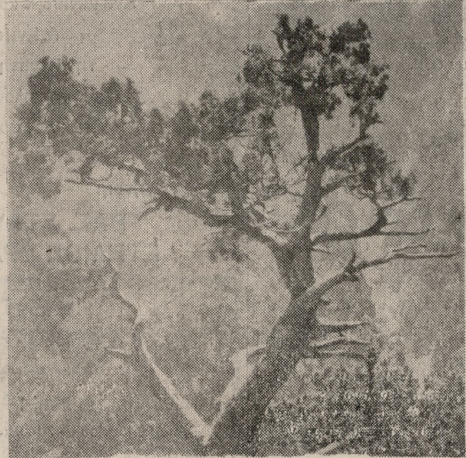
Μέχρι πότε τα δάση θα καίγονται;