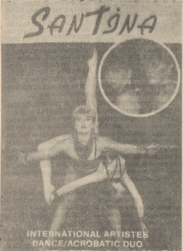
INTERNATIONAL ARTISTES DANCE/ACROBATIC DUO

ΘΑ ΣΑΣ ΓΟΗΤΕΥΣΟΥΝ Μαζί με τον καταπληκτικό Μπαλέτο « LIPSTIC SHOW » και το ατέλειωτο Λαϊκό μας Πρόγραμμα. ΔΡΟΣΙΑ ΑΠΟ ΤΕΛΕΙΟ ΚΛΙΜΑΤΙΣΜΟ