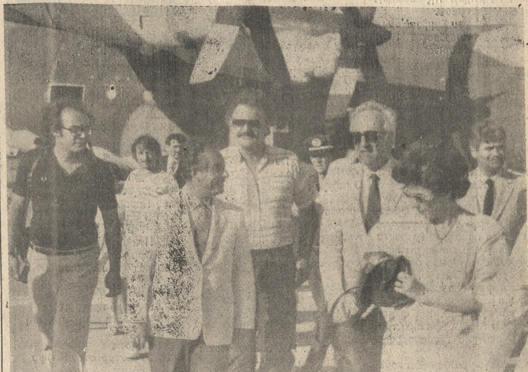
Από την άφιξη του Προέδρου της Δημοκρατίας κ. Χρήστου Σαρτζετάκη, χθες το απόγευμα, στο αεροδρόμιο της 126 Σ.Μ.