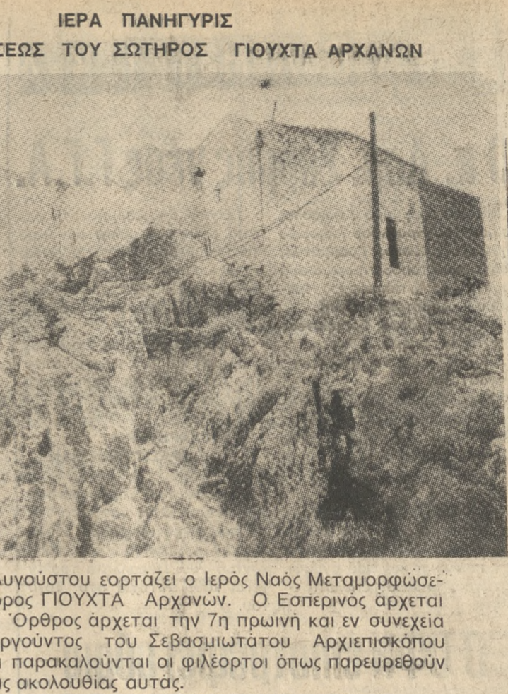
Την προσηχή Τρίτη 6 Αυγούστου εορτάζει ο Ιερός Ναός Μεταμορφώσεως του Σωτήρος εις το χωριό ΓΙΟΥΧΤΑ Αρханών. Ο Εσπερινός άρχεται την 7η απογευματινή. Ο Όρθρος άρχεται την 7η πρωινή και εν συνεχεία η Θεία Λειτουργία, ιερουργούντος του Σεβασμιωτάτου Αρχιεπισκόπου Κρήτης κ. Γ. Τιμοθέου, και παρακαλούνται οι φιλέοργοι όπως παρευρεθούν και παρακολουθήσουν τας ακολουθίας αυτές.

ΕΥΚΑΙΡΙΑ ΠΩΛΟΥΝΤΑΙ σε μια πλούσια έκθεση 1000ο εγνημένα ψυχία Β' διαλογής κατασκευασίας μεταχειρισμένα ψυχία από 7000, κοσκίνες 5000, κλωνιέρη 8000. Όλα ελεγμένα από το σέρβις μας με γραπτή εγγύηση. Αγοράζουμε το παλιό σας ψυχίο - κλωνιέρη - κοσκίνα. Αντάλλαξτε με καινούργια ταξί ταξί μοντέλα Μάξλις Κρήτης 24 - Χανιώπορτα . Τηλ. 235628 - 241753. (Π1205) 1-30 ΕΥΧΑΡΙΣΤΗΡΙΟ Θεωρώ υπερέπαιση μου να ευχαριστήσω και μέσω του Τύπου το Επιστημονικό Κέντρο Υγείας και Ομορφιάς « TOWER LINE » και τον υπεύθυνο του τμήματος Γυμναστικής και άδυναμίας κ. Νίκο Βεΐο , διότι καθόρθωσε με τις απόλυτα υγιεινές και φυσικές μεθόδους του (γυμναστική, σάουνα, υδρομασάζ, δίαιτα) να με απαλλάξει από 15,5 κιλά ανεπιθύμητο βάρος στο εξαιρετικά μικρό χρονικό διάστημα των 45 ημερών, αποκτώντας έτσι περισσότερη υγεία, δύναμη και αισιοδοξία για τη ζωή. Θεωρώ ότι χρεωστώ πολλά « TOWER LINE » γι' αυτό και του είμαι ευγνώμων. Γιώργος Σκυβαλάκης Έβρου 44, - Ηράκλειο.