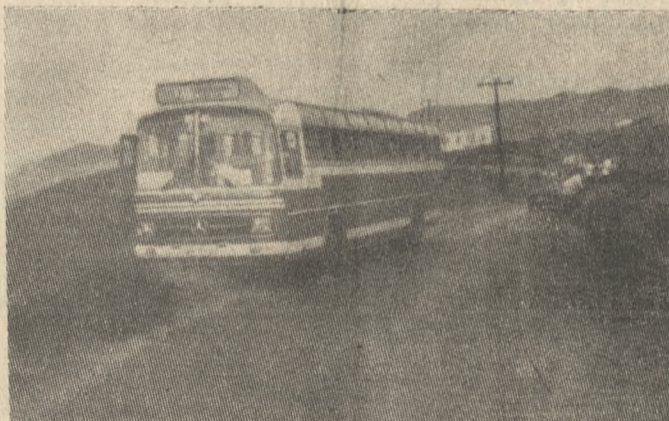
Το πούλμαν στο οποίο «καρφώθηκε» ο Ιταλός τουρίστας.

ΔΥΟ νεκροί ήταν το τραγικό αποτέλεσμα δύο σοβαρών προκλήσεων δυστυχημάτων που έγιναν την Κυριακή στο νομό Ηρακλείου. Και οι δύο νεκροί είναι αλλοδαποί.