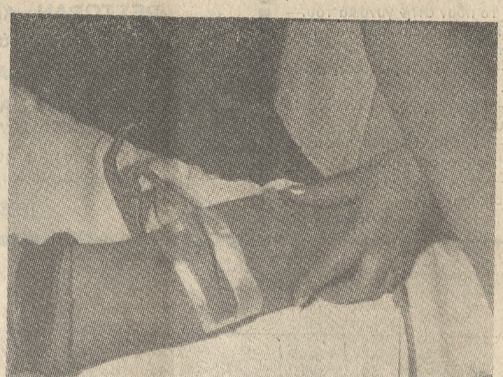
Αγωγός του ιού είναι το αίμα. Ασφαλέστερος τρόπος μετάδοσης η μετάγγιση αίματος από δότη φορέα του ιού.

Ηλεκτρονικός αναλυτής ο οποίος με την ανοσοενzymική μέθοδο θα έχει τη δυνατότητα να εντοπίζει τα αντισώματα του AIDS στο αίμα, θα εγκατασταθεί και θα λειτουργήσει για πρώτη φορά στο αιματολογικό τμήμα του Βενιζελείου Νοσοκομείου, δημιουργώντας παράλληλα μια ασφαλή υποδομή για τον εργαστήριο κλινικό έλεγχο της ασθένειας με την πρώτη εμφάνιση στην Ελλάδα το 1983.