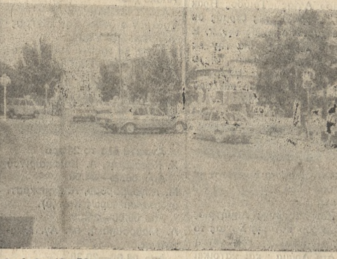
Ο κόμβος Ηροδού - Ικάρου, στην οποία απαραίτητη είναι η τοποθέτηση φωτεινών σηματοδότηων.

β. Η φρενιτή σηματοδότηση δρομικών ιδιαίτερα μεγάλη κίνηση. Το Τμήμα Τροχαίας Ηρακλείου