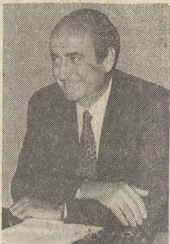
Ο κ. Κ. Μητσοτάκης.

ΑΘΗΝΑ 24 (ΑΠΕ)— Την παραίτηση του από την ηγεσία της Ν.Δ. υπέβαλε ο κ. Κ. Μητσοτάκης και συγκαλεί την Κοινοβουλευτική Ομάδα της Ν.Δ. για τη μελλομένη Πενμπήτη, και δηλώνει, ότι θα θέσει ξανά υποψηφιότητα.