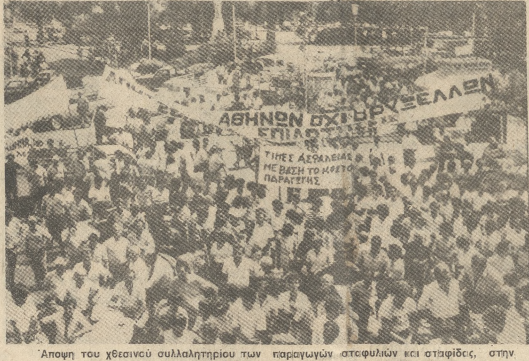
Άποψη του χθεανού συλλαλητηρίου των παραγωγών σταφυλιών και σταφίδας, στην πλατεία Ελευθερίας.