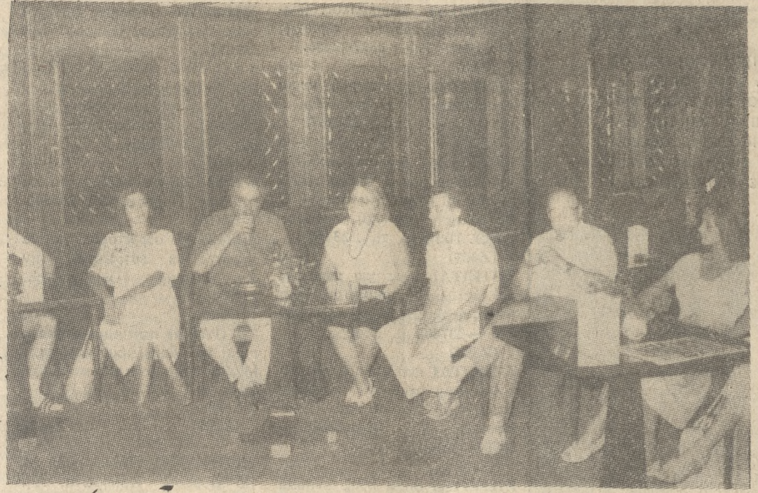
Στιγμιότυπο από τη χθεσινή συνέντευξη Τύπου, του Μπαλλέτου Κίρως.