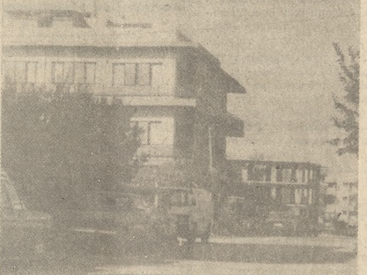
Τα νοικιαστήρια χάθηκαν από τους δρόμους και τις εισόδους των πολυκατοικιών.

Τα «ΕΝΟΙΚΙΑΖΕΤΑΙ» γρήγορα και στις γωνίες, στις εισόδους των πολυκατοικιών, στις κολώνες της ΔΕΗ, στα παρτέρα το μάτι σου δεν βρήκε πια στις χαρακτηριστικές ταμπέλες με το ξεθωριασμένο κόκκινο χρώμα «ΕΝΟΙΚΙΑΖΕΤΑΙ». Κι όμως την ίδια στιγμή στην πόλη αυτή με τα «παρτέρα να σπύρανε και με τον ολόκληρο και αυξανόμενο πληθυσμό που δημιουργεί περισσότερες ανάγκες, άνθρωποι, οικογένειες με τις αποσκευές να περιμένουν «παταλιάρικες» σε κάποια υποθήκη ή εταιρεία μεταφορών να γίνουν απεγνωσμένα για να βρουν και να νοικιάσουν σπίτι. Τρέχουν στις εγγυησίες, από τα χαρμάτα ή και από το βράδυ ακόμα, μόλις ο κωμικοδοκίμος βγει στους δρόμους για την διαμονή, απαντώντας σε γνωστούς, φίλους, συνάδελφους και στα μεσιτικά Γραφεία ακόμη!