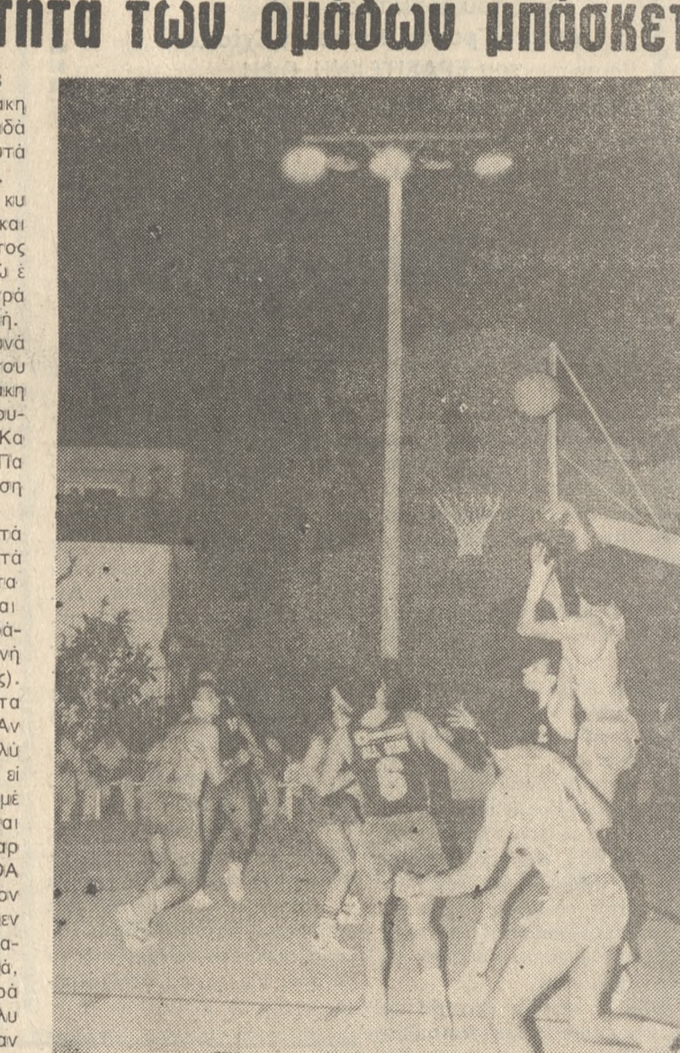
Ένα στιγμιότυπο από ανάμεσα Μπάσκετ της περιφερειακής περιόδου.