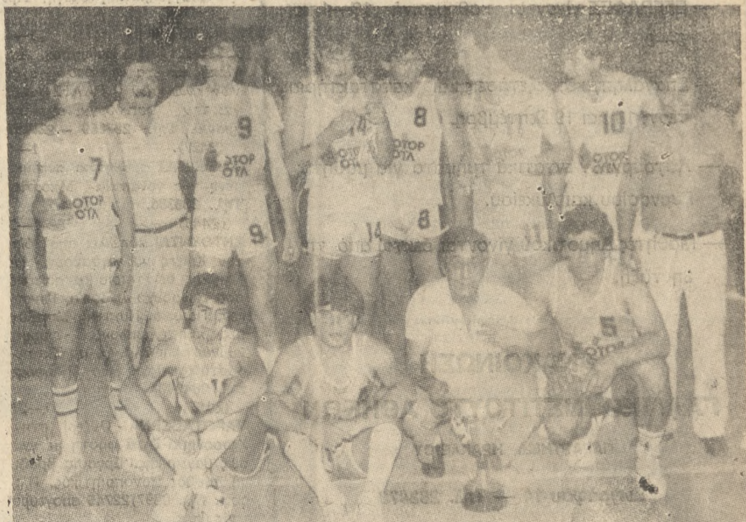
Η Ανδρική ομάδα Μπάσκετ του Εργοτέλη που βγήκε πρωταθλήτρια Κρήτης την περίοδο που μας πέρασε (1984—85) και η οποία αναμένεται να πρωταγωνιστήσει και στην φετινή αγωνιστική περίοδο.