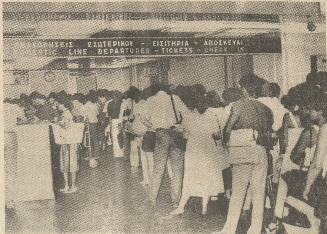
Παρά τα βήματα που έγιναν οι ουρές στο αεροδρόμιο, δεν σταμάτησαν.

ΑΙΦΝΙΔΙΑΣΤΙΚΟ έλεγχον στον Κρατικό Αερολιμένα Ηρακλείου, πραγματοποιήσε στα μέσα Αυγούστου η Ι.Α.Τ.Α. (Παγκόσμια Ένωση Ιπταμένων Φροντιστών) προκειμένου να διαπιστωθούν τα μέτρα ασφαλείας και ελέγχου σε συνδυασμό πάντα με το ενδεχόμενο μιας πιθανής αεροπειραγίας. Τα πορίσματα του ελέγχου που ως σημειωθεί πραγματοποιήθηκε εν αγνοία των υπευθύνων, θεωρήθηκαν ιδιαίτερα τιμητικά, αφού το Αεροδρόμιο Ηρακλείου χάρακτηρίζεται ένα από τα πιο ασφαλή στο χώρο της Μεσογείου.