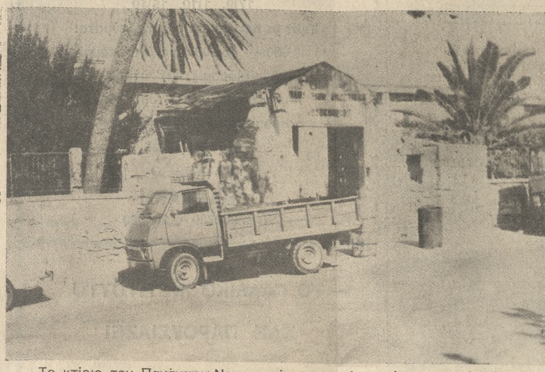
Το κτίριο του Πανανείου Νοσοκομείου, που τώρα είναι εγκαταλειμένο κι έχει μετατραπεί σε οκουπόδοτοπο.