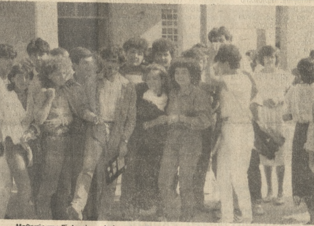
Μαθητές της Γ Λυκείου μιλούν στην «Π» για το πρόβλημα του κτηρικού.