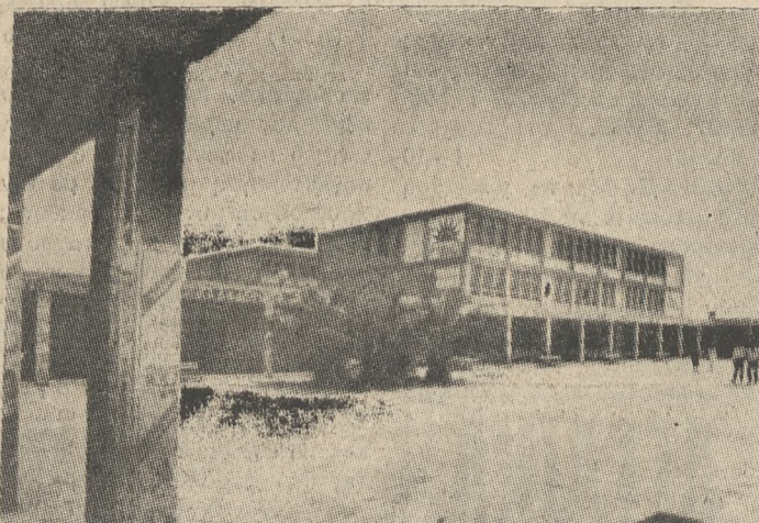
Το Τ.Ε.Ι. Ηρακλείου. Βήματα μπροστά, αλλά με προβλήματα.

ΠΡΟΒΛΗΜΑΤΑ ΣΠΟΥΔΩΝ ΚΑΙ ΥΠΟΔΟΜΗ ΠΑΡΑΜΕΝΟΥΝ ΑΛΥΤΑ