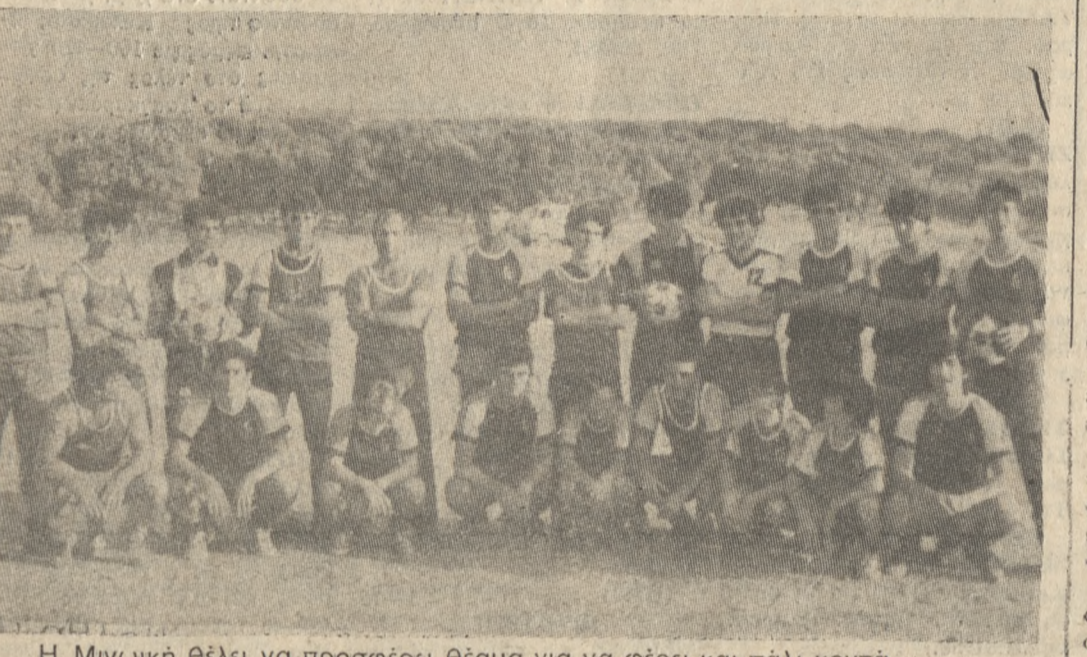
Η Μινωϊκή θέλει να προσφέρει θέαμα για να φέρει και πάλι κοντά τους φιλάθλους της.

ΜΕ σκληρή προπόνηση σε ένα περιβάλλον μακριά από το Ηράκλειο και με προπονητή τον κ. Τσακιρόγλου προπονήθηκε η Μινωϊκή. Συγκεκριμένα μέσα σε ένα ελαιώφυτο, μακριά από τα κτιστήρια της πόλης και με την ανανέωση που έκαναν οι παράγοντες της ομάδας στοχεύουν να συζητήσουν την παράδοση του ερασιτέχνη δικού τους.