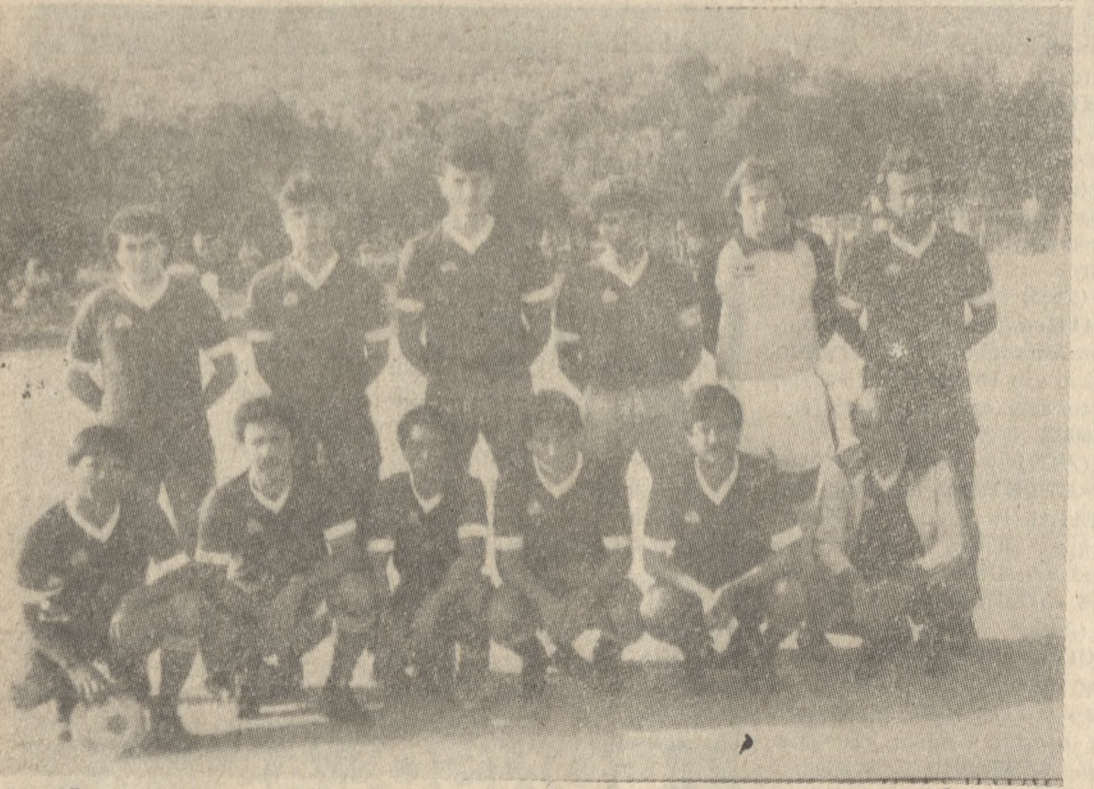
Η ομάδα της Τυλίσοος που ξεκινάει ενταπαινωσικά το φετινό πρωτάθλημα Α' Κατηγορίας