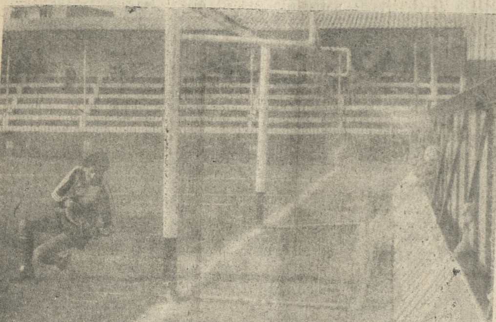
C. Γιάννινι έχει ξεγελάσει τον Μπαρμπολιά και στέλνει την μπάλα στα δίχτυα, αξιοποιώντας το πέναλτυ που κέρδισε ο Βλαστός.