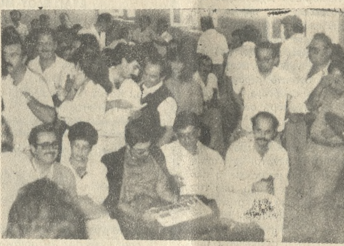
Ένα στιγμιότυπο από τη χθεσινή γενική συνέλευση του Δικηγορικού Συλλόγου Ηρακλείου, στην οποία αποφασίστηκε η συνεισφορά της αποχή επί αόριστο.

ΕΛΛΑΔΑΣ - Γ.Α.Δ. Συμφωνία για την ανάπτυξη των οικονομικών σχέσεων με την Ανατολική Γερμανία ώστε να μειωθεί το μεγάλο άνοιγμα που παρουσιάζει το εμπόριο ισοζύγιο εις βάρος της χώρας μας θα επιδώσει η ελληνική Κυβέρνηση κατά τις συνομιλίες με τον γερμανό ηγέτη της ΓΑΔ Μεταξύ των άλλων θεμάτων που θα συζητηθούν κεντρική θέση κατέχουν η λύση του ανταλλακτικού προβλήματος των πολιτικών προσφύγων που