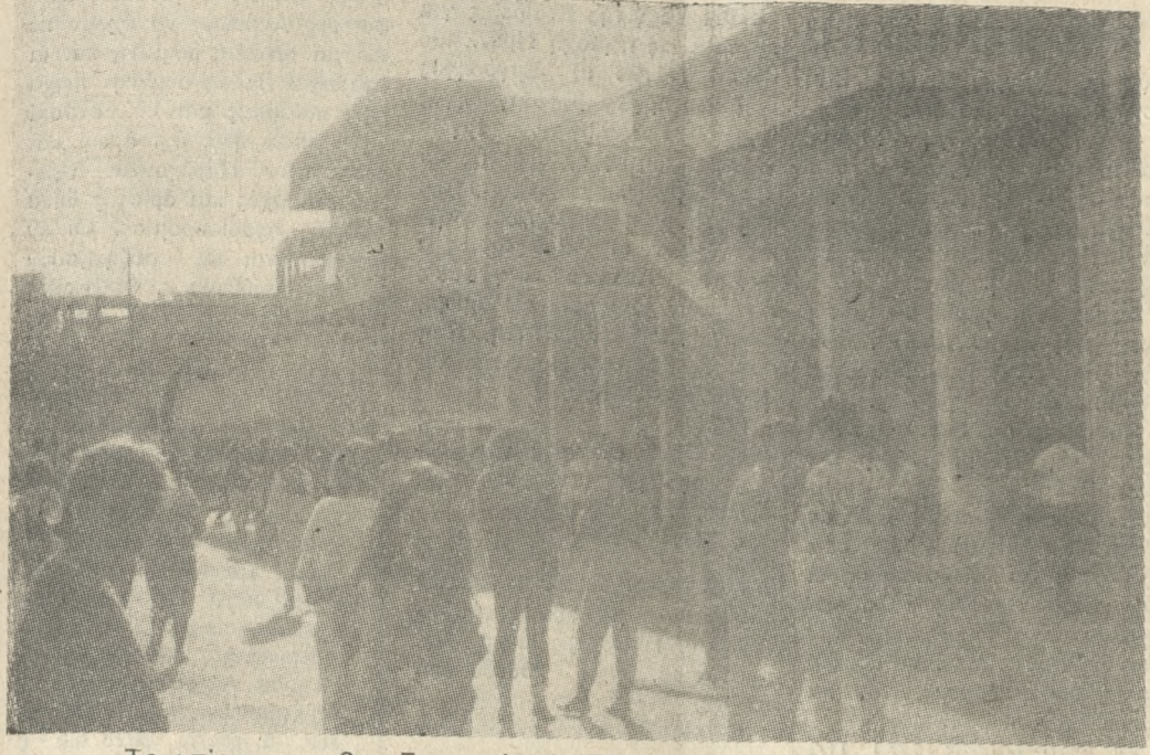
Το κτίριο του 2ου Γυμνασίου. Έξι σχολεία και πάνω από 2000 μαθητές στριμύχονται καθημερινά σ' αυτό...