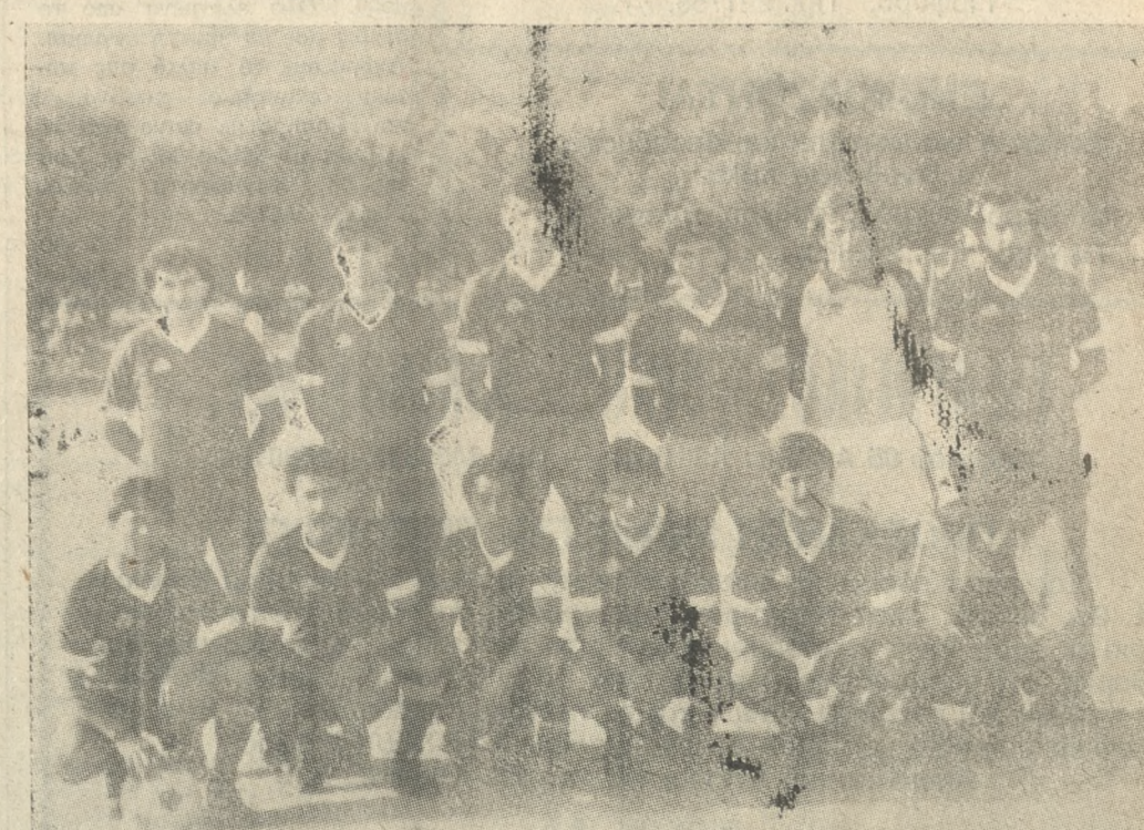
Ο Α.Ο. Τυλίσσου, ο οποίος βρίσκεται στην κορυφή του Β' Ομίλου του τοπικού πρωταθλήματος Α' Κατηγορίας.

Παρακολουθούνται όσοι ενδιαφέρονται να παρακολουθήσουν το σεμινάριο.