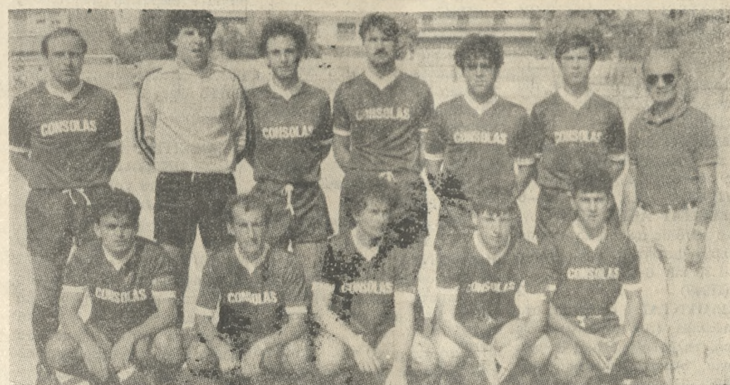
ΑΥΡΙΟ ΤΟ ΑΠΟΓΕΥΜΑ ΣΤΗΝ ΑΛΙΚΑΡΝΑΣΣΟ