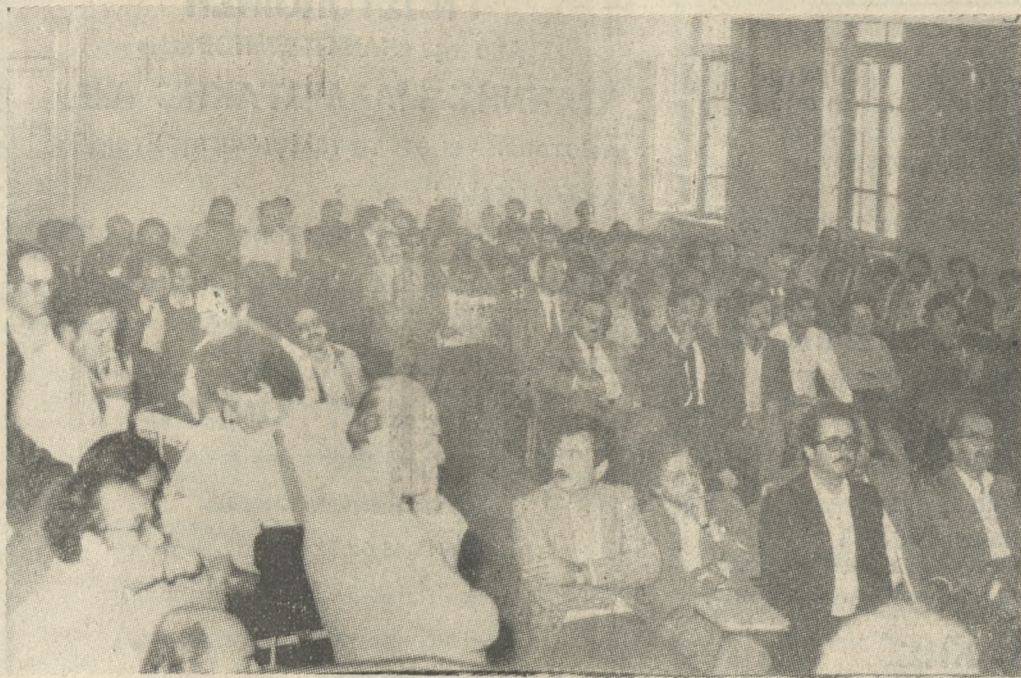
Στιγμιότυπο από την Γενική Συνέλευση των Δικηγόρων.

ΜΕ ΧΘΕΣΙΝΗ ΑΠΟΦΑΣΗ ΤΗΣ Γ.Σ. ΤΟΥ ΣΥΛΛΟΓΟΥ