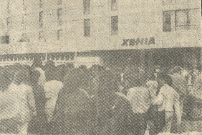
Οι σπουδαστές της Σχολής ΣΤΕΦ του ΤΕΙ, έξω από το «ΞΕΝΙΑ» χθες το πρωί.

Τέλος συμφωνήσε με πληροφορίες χθες βράδυ συνδρίασε το Διοικητικό Συμβούλιο της Ισπανικής Σχολής για να αποφασίσει αν θα καταργηθεί ο κύκλος σπουδών των φοιτητών. Σε περίπτωση που συμβεί κάτι τέτοιο οι φοιτητές ετοιμάζουν κινητοποιήσεις.