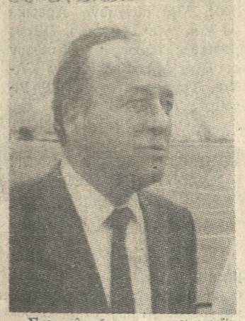
Στο κλειστό της φωτογραφίας ο κ. Αντρέι χθες στο αεροδρόμιο Ηρακλείου, κατά την αναχώρησή του από την πόλη μας.

Επίσκεψη «αστραπή» για να γνωρίσει την Κρήτη και τους αρχαιολογικούς χώρους πραγματοποιήθηκε χθες στην πόλη μας ο υπουργός εξωτερικών της Ρουμανίας κ. Αντρέι. Τον ξένο επίσημο υποδέχθηκε χθες το πρωί στο αεροδρόμιο Ηρακλείου ο Νομάρχης κ. Μανώλης Λουκάκης. Ο κ. Αντρέι επισκέφθηκε στη συνέχεια το Μουσείο και την Κνωσό, και αναχώρησε επιστρέφοντας στην Αθήνα στις 3 το μεσημέρι.