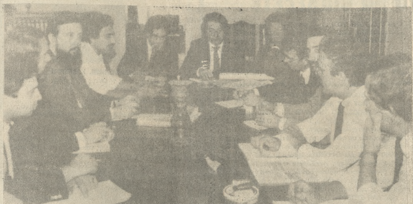
Στημιότυπο της χθεσινής σύσκεψης για το Μ.Ο.Π. Κρήτης με τα μέλη της Επιτροπής των Ευρωπαϊκών Κοινοτήτων και τους Νομάρχες της Κρήτης στην αίθουσα συσκέψεων της Νομαρχίας Ηρακλείου.