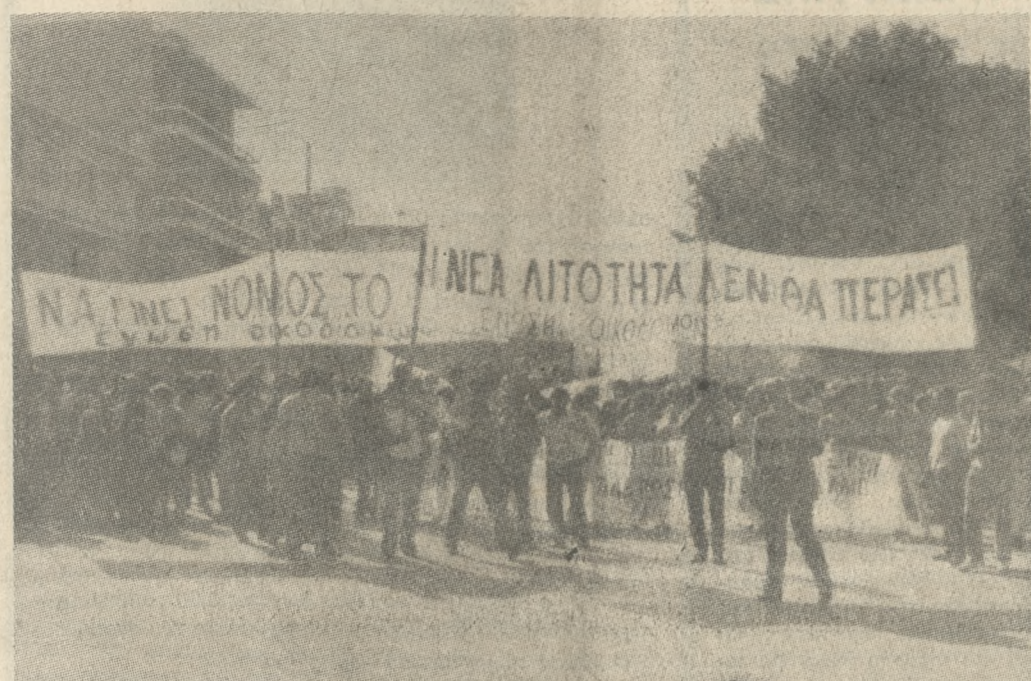
Μια όψη από την απεργιακή συγκέντρωση της Πέμπτης.