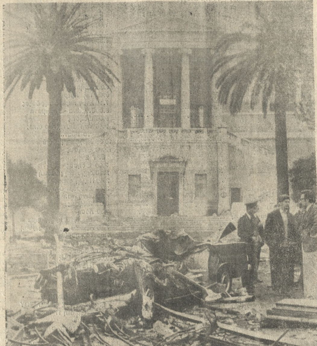
Ένα ηθικό χρέος απαντάται στη μνήμη των νεκρών του Πολυτεχνείου.

Ανακοίνωση επίσης εξέδωσε η Τ.Ο. Ηρακλείου της Χριστιανικής Δημοκρατίας στην οποία χαιρετίζεται η 12η επέτειος της εδραίωσης του Πολυτεχνείου και σημειώνεται ότι η Χ.Δ. συμμετέχει στο γιορταστικό, εκπληρώνοντας έτσι