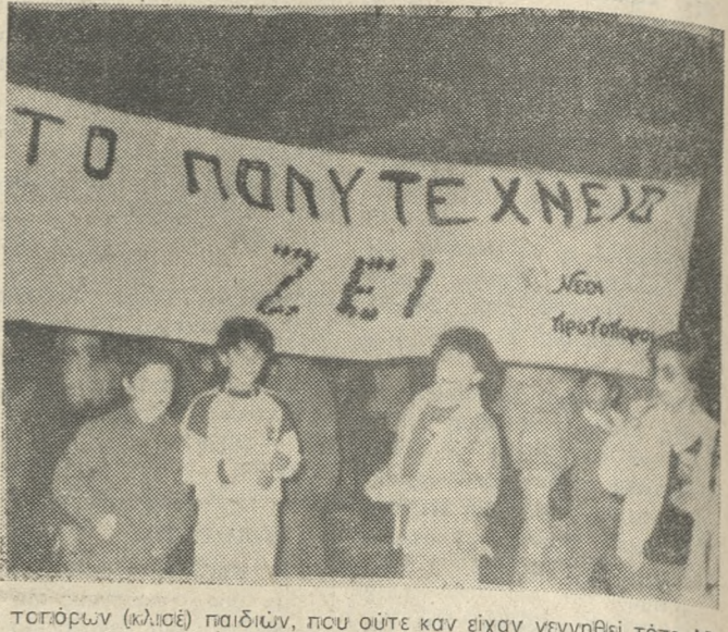
Τοπικών (κίτριε) παιδιών, που ούτε καν είχαν γεννηθεί τότε. Με το δικό τους πανύ φταγμένο με γαρυφαλίνα, φινιζόναν συνθήματα συνδέοντας τα δικά τους όραματα με αυτά της γενιάς του Πολυτεχνείου.

ΜΕΡΙΚΕΣ ξεχωριστές στιγμές είχε η φετινή πορεία του Ηρακλειώτικου Λόγου και της Νεολογίας του Ηρακλείου. Άνθρωποι από όλες τις ηλικίες, άνθρωποι που έζησαν παράνοια «Πολυτεχνείο» καλύτερα, άνθρωποι της ίδιας της γενιάς του νεότερου Έλληνακού έπους, χέρι - χέρι, τιμήσαν την επέτειο. Αυτό όμως που έκανε ιδιαίτερη εντύπωση ήταν η εμφάνιση των Νέων πρω-