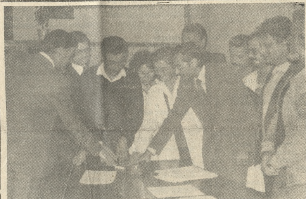
Στιγμιότυπο από την χθεσινή τελετή ορκωμοσίας των δεκαεσσάρων πρώτων γιατρών πλήρους και αποκλειστικής απασχόλησης που αναλαμβάνουν σήμερα υπηρεσία στο Βενιζέλειο Νοσοκομείο.