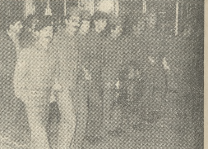
κάστηκαν να σφύρασαν τα όπλα εναντίον των αδελφών τους. Σήμερα βόδιζουν μαζί τους στον ίδιο δρόμο, του αγώνα, τιμώντας την εξέγερση. Στο κίσιε, μερικοί από τους στρατευμένους που μετέβησαν στην πορεία.

ΟΜΩΣ ιδιαίτερα σημαντική ήταν η παρουσία δεκάδων στρατευμένων νέων, που τιμητικά βόδιζαν πίσω από τη Συντακτική Επιτροπή. Η παρουσία τους σημαίνει σίγουρα πολλά. Τότε ανα-