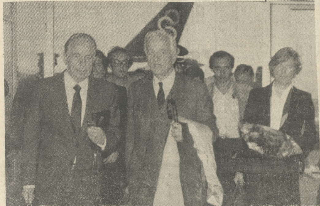
Ο Πρόεδρος της Ομοσπονδιακής Δημοκρατίας της Γερμανίας κ. Βαϊτσέκε, με την σύζυγό του και τον Πρόξενο της Γερμανίας στο Ηράκλειο, κατά την άφιξή του στο αεροδρόμιο Ηρακλείου, χθες το απόγευμα.

Τζανακάκη, Γενικό Διευθυντή της Γενικής Διεύθυνσης Αστυνομίας Αττικής, δια λόγους που αφορούν το συμβόλιον της Υπηρεσίας και ειδικότερα προκειμένου να προχωρήσει η σε βάρος έρευνα, σχετικά με το θάνατο του Κολέτσα Μιχαήλ, να καταλογισθούν, όπου υπάρξουν, οι αντίστοιχες ευθύνες και κυρώσεις και να διασφαλιστεί το κύρος της Ελληνικής Αστυνομίας.