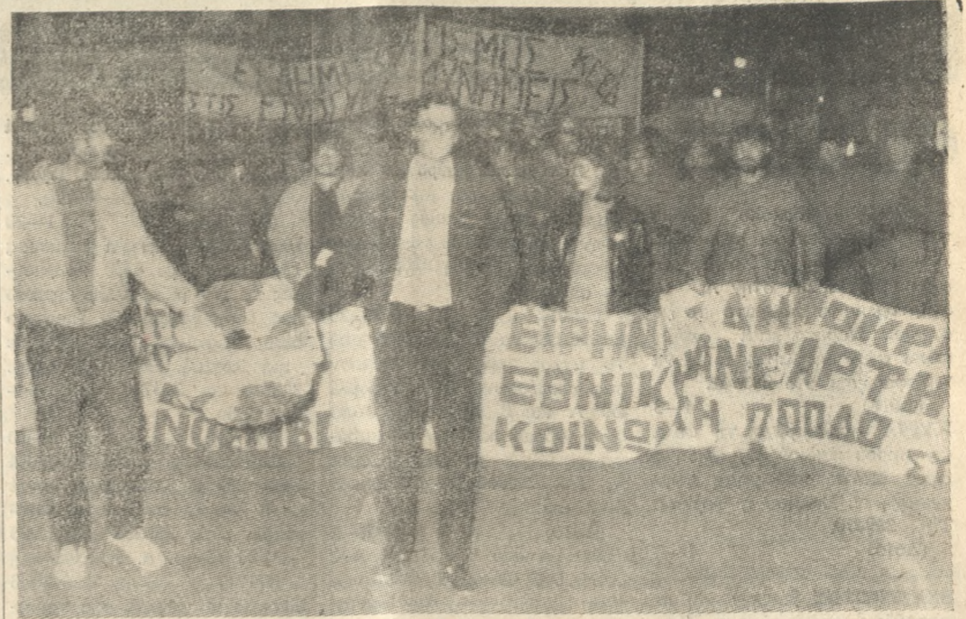
Η «κεφαλή» της Κυριακάτικης πορείας. Προπορεύεται η Συντονιστική Επιτροπή, και ακολουθούν οι φανταροί.

Μπορείτε, μέχρι να συνήθει ο οργανισμός, να περιορίσουμε αυτά τα φαινόμενα, αν μειώσουμε κάπως όφες τα όσπρια, πριν τα μαγειρέψουμε.