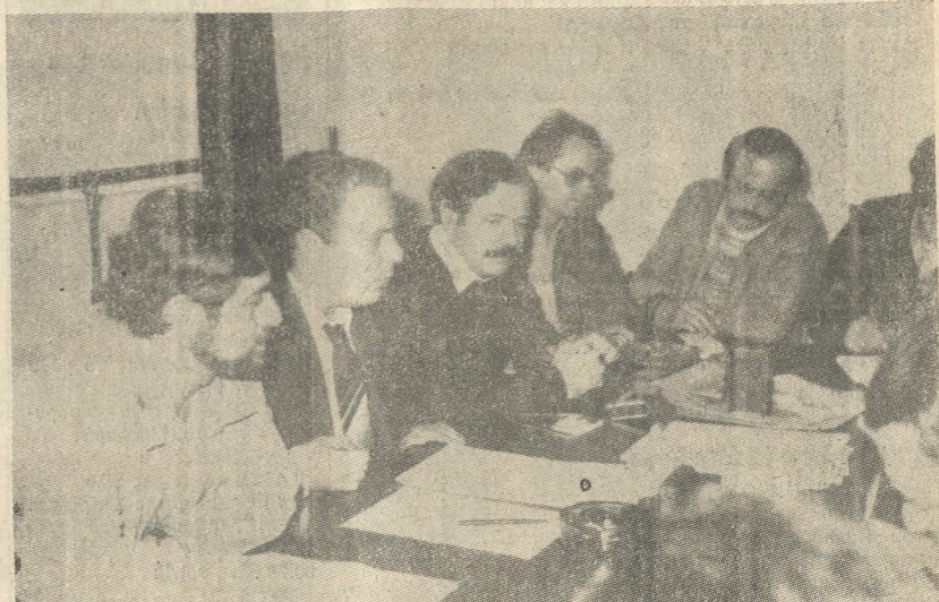
Ένα στιγμιότυπο από την χθεσινή συνέντευξη Τύπου της Διοίκησης του Φαρμακευτικού Συλλόγου Ηρακλείου - Λασιθίου.

ΑΘΗΝΑ 6 (ΠΕ) — Σχετικά με τις Ελληνοτουρκικές σχέσεις επανέλαβε ότι το τουρκικό κατεστημένο μεροδύσει και χαράσσει πορεία προς το Αιγαίο και περί αυτού. Στον μακροπρόθεσμο σχεδιασμό της Αγκυρας, είπε, είναι η συγκυριαρχία ή ο διαιερισμός του Αιγαίου. — Σχετικά με το Κυπριακό, αφού παρατήρησε ότι η Αθήνα δεν αποκαίει να αναμειχθεί στις διεξαγόμενες στην Κύπρο εκλογές την Κυριακή, επεσήμανε ότι επιχειρείται να εμφανισθεί το Κυπριακό πρόβλημα όχι ως πρόβλημα κατ' αρχήν, αλλά ως θέμα σχέσεων των δύο Κοινοτήτων του νησιού. — Για τις Ελληνονατοϊκές σχέσεις επανέλαβε ότι η συμφωνία Ρότζερς είναι ανενεργός για δύο λόγους: Το Στρατηγείο της Λάρσας και το θέμα της Λήμνου. Στο θέμα αυτό (της Λήμνου) είπε, οι ΗΠΑ και το ΝΑΤΟ μιλάνε για νομική διαφορά μετά ξυ Αλλάδας και Τουρκίας τηρών τους ίσες αποστάσεις.