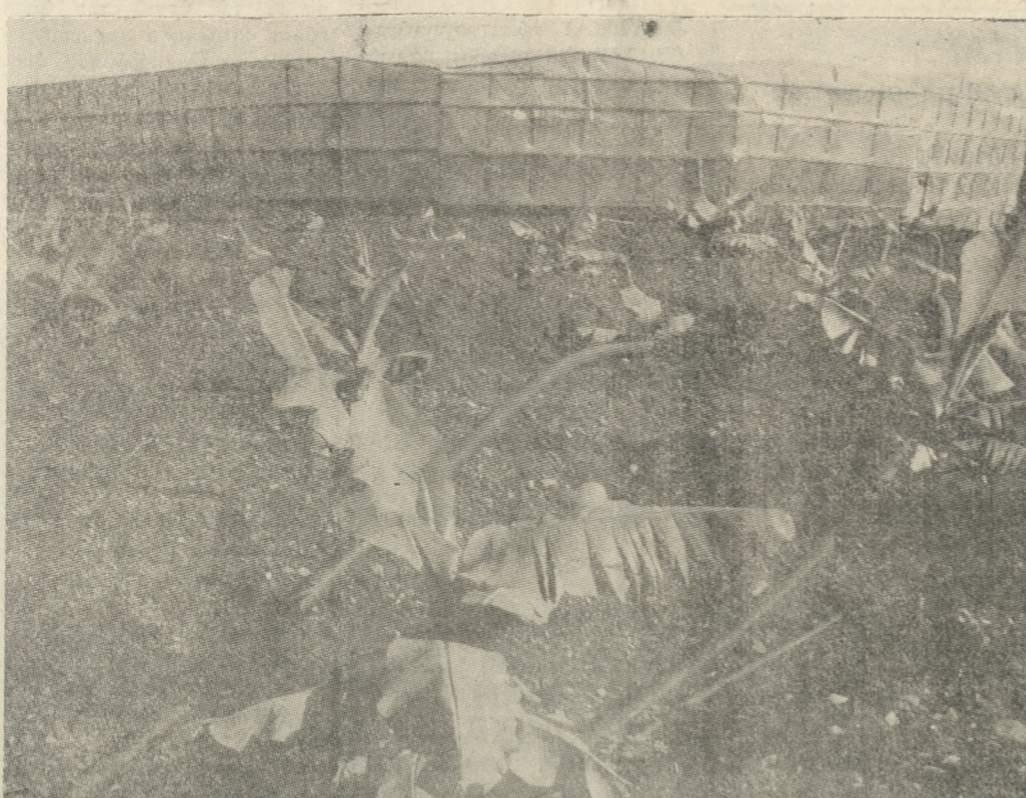
Οι πλαστικές σωλήνες άρδευσεως και το φύλλο θερμοκηπίου της KANTIA ΠΛΑΣΤ Α.Ε. , κατέκτησαν την αγορά. Χρησιμοποιούνται ευρύτατα από τους καλλιεργητές.

Απάντ. Πριν σας απαντήσω Συνέχεια στην σελίδα 5