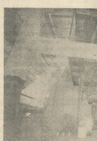
Το υπερσύγχρονο μηχανήμα παραγωγής φύλλου θερμοκηπίου σε λειτουργία στο εργοστάσιο της KANTIA ΠΛΑΣΤ Α.Ε.

Απάντ. Σας είπα και παραπάνω ότι με την είσοδο στην α-