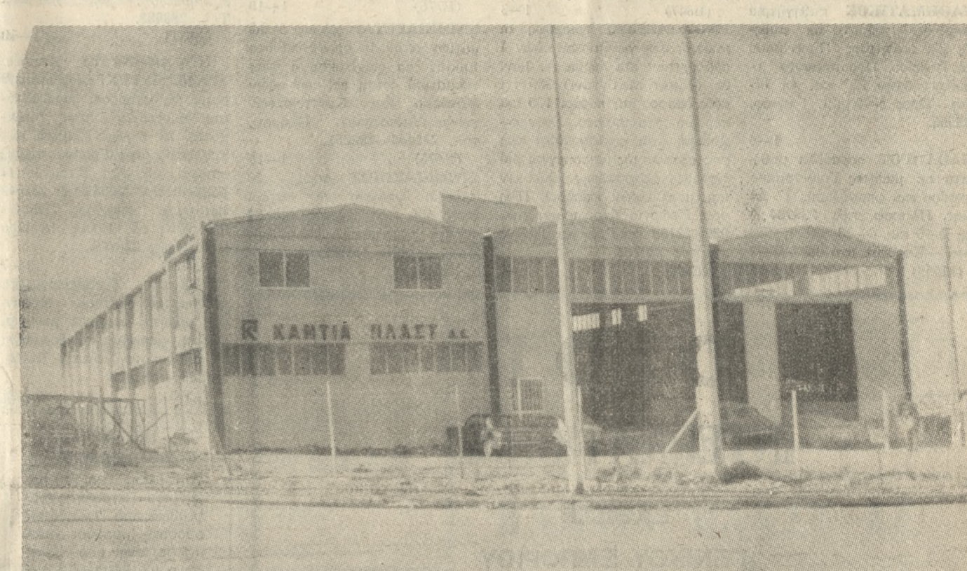
Το βιομηχανικό συγκρότημα της KANTIA ΠΛΑΣΤ Α.Ε. στην Βιομηχανική Περιοχή Ηρακλείου, κτισμένο σε οικόπεδο έξι στρεμμάτων.

Εμείς ζειμσταν εκείνοι που εργαζόμαστε σε άμεση επαφή με τον πελάτη μας που δεν είναι άλλο από τον καλλιεργητή, τον αγρότη της Κρήτης. Εμείς θα του λύσουμε το πρόβλημά του, εφοδάζοντάς τον με ένα άριστο επαναλαμβανόμενο προϊόν, το οποίο θα τον βοηθήσει να αυξήσει την παραγωγή του και να βελτιώσει την ποιότητα του προϊόντος του. Έτσι λοιπόν δημιουργούμε και αναπτύσσουμε μια άλλη σχέση με τον πελάτη μας. Αλλά και τέλος να μην ξεχνάμε ότι ζούμε στην Κρήτη και είμαστε από την Κρήτη. Τόσο οι καλλιεργητές όσο και εμείς η KANTIA ΠΛΑΣΤ Α.Ε. πασιζούμε να βελτιώσουμε την οικονομία αυτού του τόπου. Παρεμπιπτόντως θα σας πω ακόμη ότι μέχρι τώρα έχουμε δημιουργήσει στο