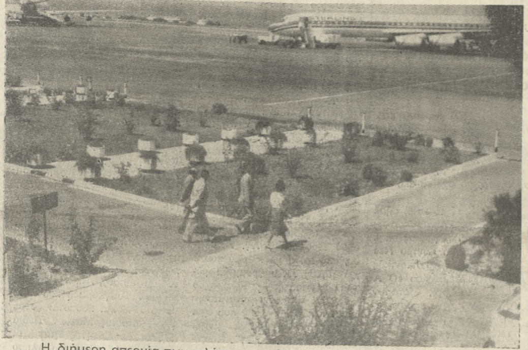
Η διήμερη απεργία των πιλότων της Ο.Α., που είχε σαν αποτέλεσμα να μην γίνουν πτήσεις, καθώς και η μεγάλη ζήτηση εισιτηρίων, επιβάλλουν τον προγραμματισμό έκτακτων πτήσεων.