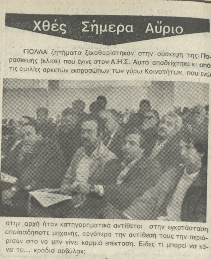
ΠΟΛΛΑ ζητήματα ξεκαθάριστ' στην σύσκεψη της Παρασκευής (κλίση) που έγινε στον Α.Η.Σ. Αυτό αποδείχτηκε κι από τις ομιλίες αρκετών εκπροσώπων των γύρω Κοινοτήτων, που ενώ στην αρχή ήταν κατηγορηματικά αντίθετοι στην εγκατάσταση οποιασδήποτε μηχανής, αργότερα την αντίθεσή τους την περιορίζουν στο να μην γίνει κομμάτι επέκτασης. Είδες τι μπορεί να κάνει το... «ράδιο αβύσσου»!