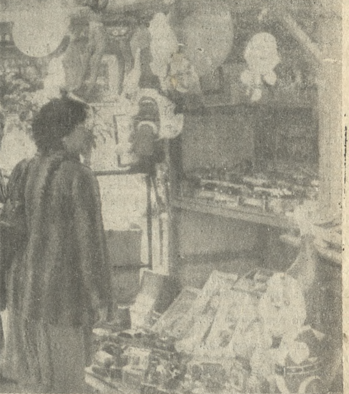
Στην πρώτη θέση των Καταστημάτων των υποθηριών πάγκων, τα παιγνίδια. Άλλωστε, η Πρωτοχρονιά είναι τυπικά γιορτή των παιδιών.