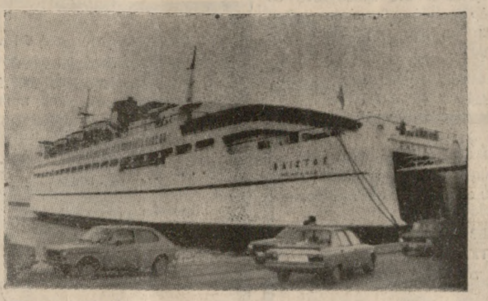
Το «ΦΑΙΣΤΟΣ» στο λιμάνι του Ηρακλείου, λίγο μετά που έδωσε.

Τη στιγμή της αλλαγής του χρόνου ή στη διάρκεια των πρώτων στιγμών του, η ζωή κυλούσε και τα γεγονότα το ένα μετά το άλλο «μετρούσαν» στο χρόνο. Κοινωνικά, αστυνομικά και άλλα γεγονότα, είναι καταγεγραμμένα στις πρώτες στιγμές του χρόνου που ήδη είναι τριών ημερών. Παιδιά είναι όμως αυτά, χαρούμενα ή και λυπηρά; Ας τα δούμε αναλυτικότερα.