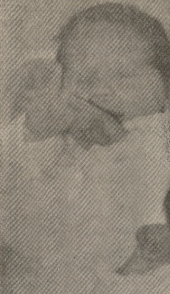
Τα δύο δίδυμα κοριτσάκια κ. Φανταουτσάκη - Λιανάκη, στη θερμοκοιτίδα.

Της κ. Ειρήνης Φουρνάρη (κορίτσι) στις 4 το πρωί στον «Αγ. Ελευθέριος».