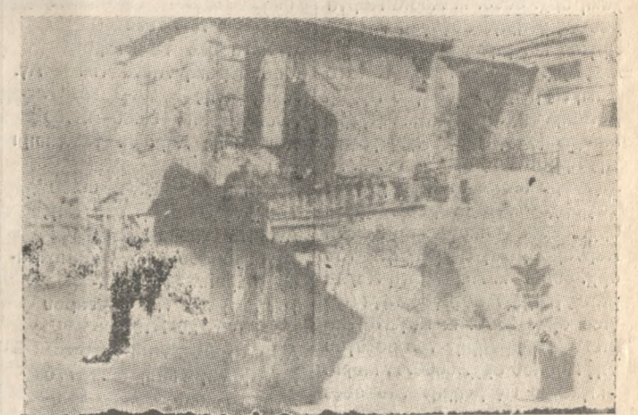
Ένας δρόμος της Αγίας Τριάδας, που χρειάζεται αναβάθμιση. Η οδός Σαρβαθιανών. Η φωτογραφία παρουσιάστηκε στην Έκθεση της κ. Καλοκύρη.

«Η ανάγκη αναμόρφωσης της υποβαθμισμένης περιοχής της Αγ. Τριάδας μ' έκανε να επιλέξω ως θέμα της μελέτης μου αυτή τη συνοικία. Μια συνοικία που βρίσκεται σε «κατάσταση ανάγκης». Αυτό τόνισε στην «Π» η Αρχιτέκτων Ναταλία Καλοκύρη-Πιγκέ η οποία παρουσίασε στην αίθουσα της Βασιλικής του Αγίου Μάρκου έκθεση φωτογραφιών και αρχιτεκτονικών σχεδίων με θέμα την αναμόρφωση της Αγ. Τριάδας.