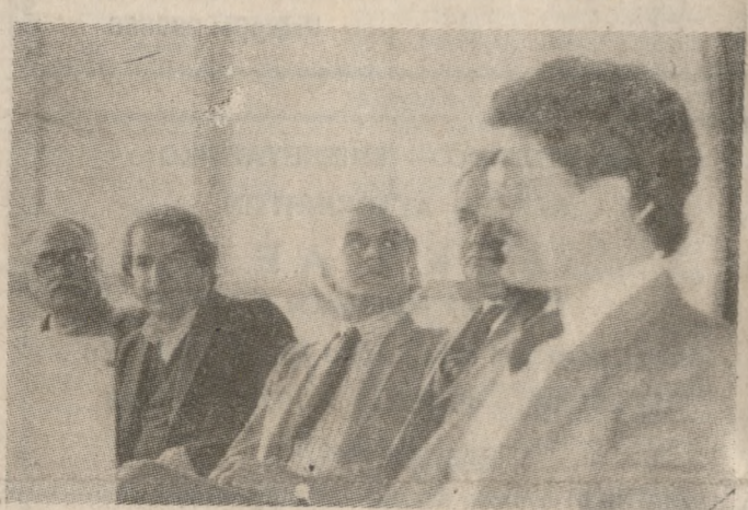
Από την χθεσινή επίσκεψη του κ. Τσοχατζόπουλου, στο Πανεπιστήμιο Κρήτης.

ΤΟ ΠΑΣΟΚ είναι πάντα με τον λαό, αλλά αυτή την στιγμή θέλουμε να επανασυνδέσουμε τον τρόπο της καθημερινής μας πολιτικής πρακτικής με τα προβλήματα του λαού και του τόπου. Σε αυτό, πιστεύω, ότι οι κομματικές διαδικασίες θα συμβάλλουν καθοριστικά. Την απάντηση αυτή έδωσε χθες, αμέσως μετά την άφιξη του στο αεροδρόμιο Ηρακλείου, το μέλος του Εκτελεστικού Γραφείου και Υπουργός Προεδρίας της Κυβέρνησης κ. Άκης Τσοχατζόπουλος. Ο κ. Τσοχατζόπουλος, που έφτασε επικεφαλής Κλιμακίου της Καθοδήγησης του Κινήματος στις 2 μ.μ. χθες στο Ηράκλειο, απαντώντας σε σχετικές ερωτήσεις είπε: «Κατ' αρχήν χαιρόμαι που μου δίνεται η δυνατότητα να ξανάρθουμε στην Κρήτη και στο Ηράκλειο όπου δεν χρειάζεται να το νιώσω, το στοιχείο της δημοκρατικής παράδοσης και της ουσιαστικής συμμετοχής για την πρόοδο και προκοπή του τόπου, είναι γνωστό. Στα πλαίσια αυτού του διήμερου θα έχουμε την δυνατότητα, στα πλαίσια της οργάνωσης του ΠΑΣΟΚ να συζητήσουμε για την πορεία του Κινήματος, την συμμετοχή της οργάνωσης στην παραπέρα εξέλιξη